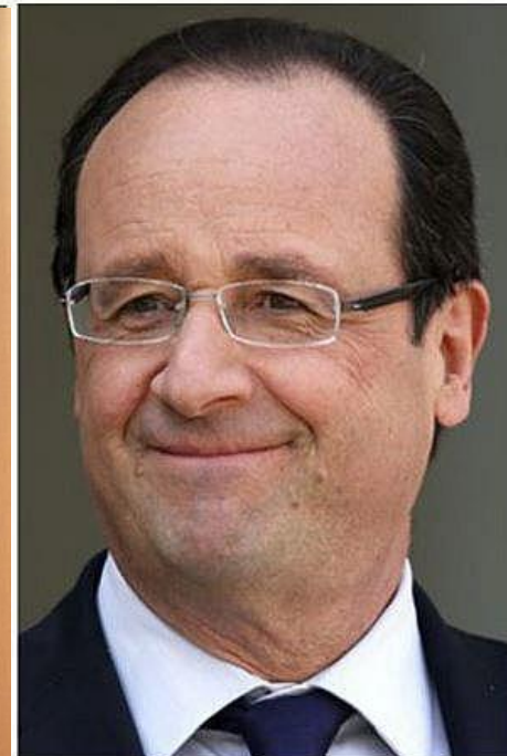
UN VRAI CUL..... D'UN FAUX