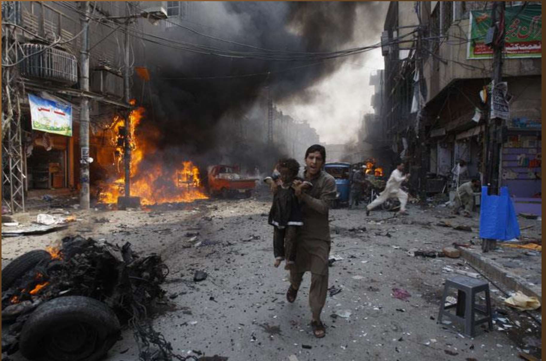
33. Un homme porte un enfant pour l'emmener loin du lieu d'un attentat à la bombe au Pakistan