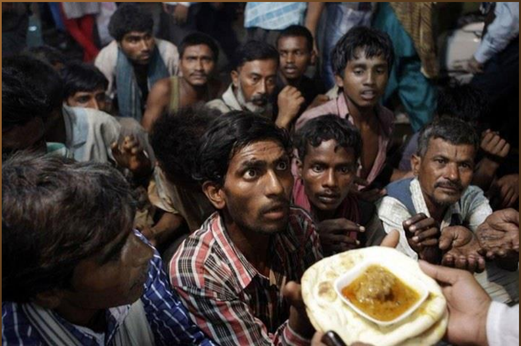
11. Des sans-abris attendant de recevoir de la nourriture gratuite à l'extérieur de la mosquée de New Delhi, en Inde