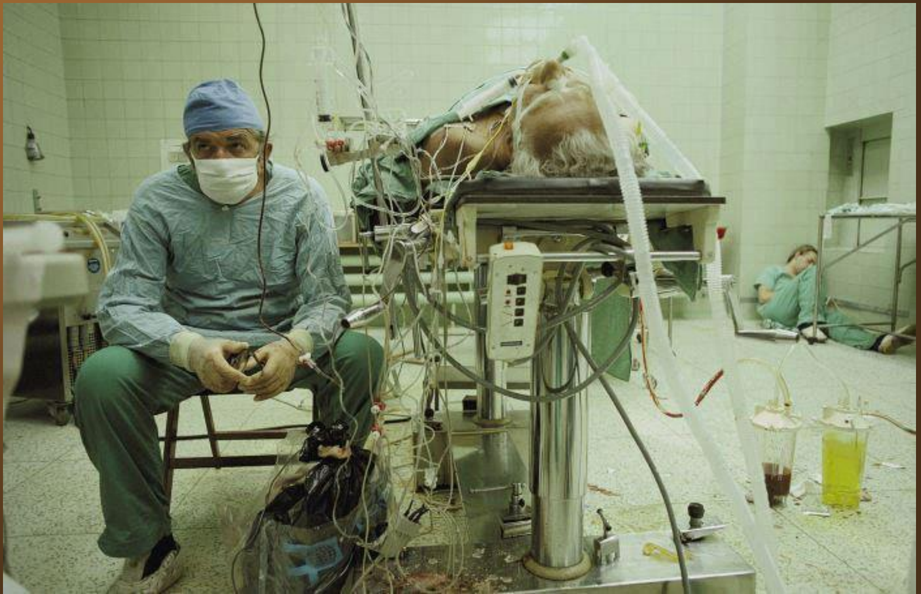
3. Un chirurgien et son assistante exténués après une transplantation du coeur réussie qui aura duré 23 longues heures