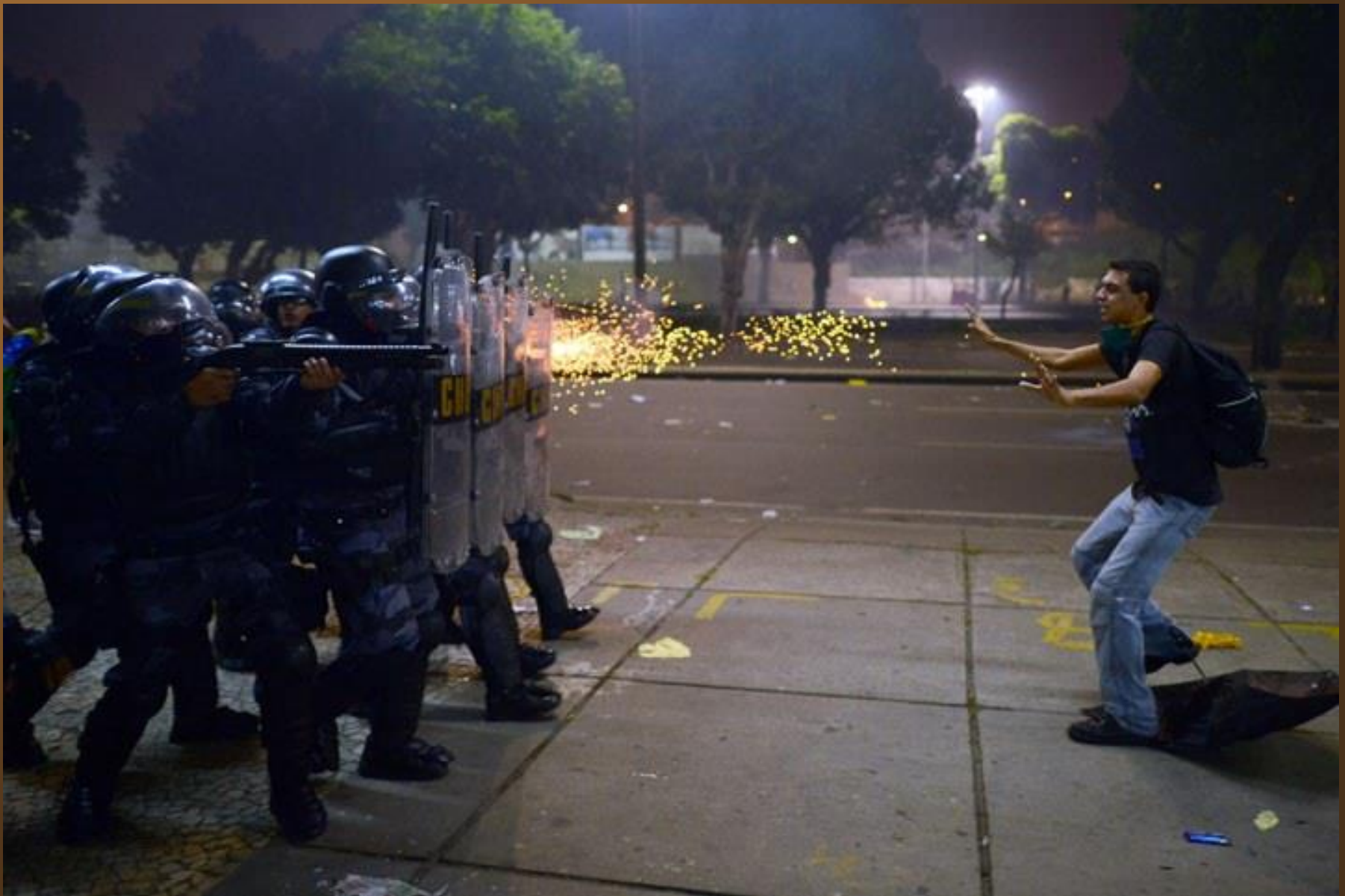
9. Un manifestant abattu par des balles à blanc à Rio de Janeiro, Brésil.