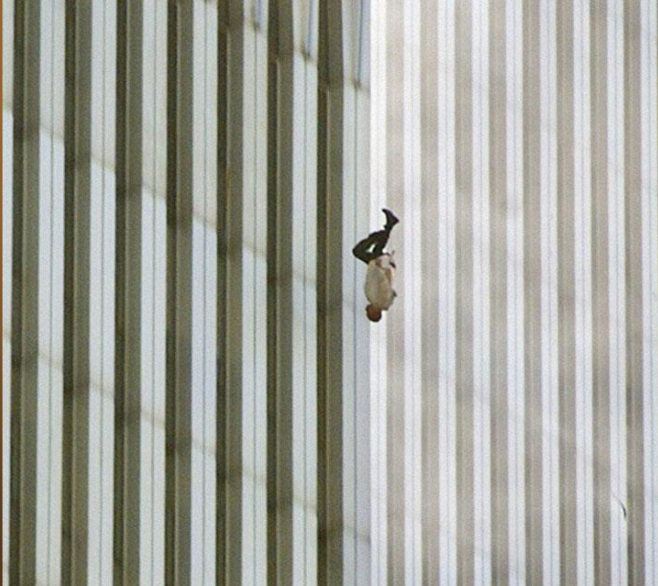
31. « The Falling Man ». Un homme tombant du World Trade Center après que les avions aient percuté les deux tours new-yorkaises le 11 septembre 2001