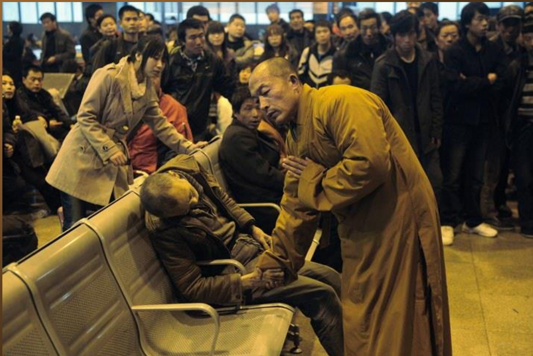
15. Un moine prie pour un homme subitement décédé en attendant le train à Shanxi Taiyuan en Chine