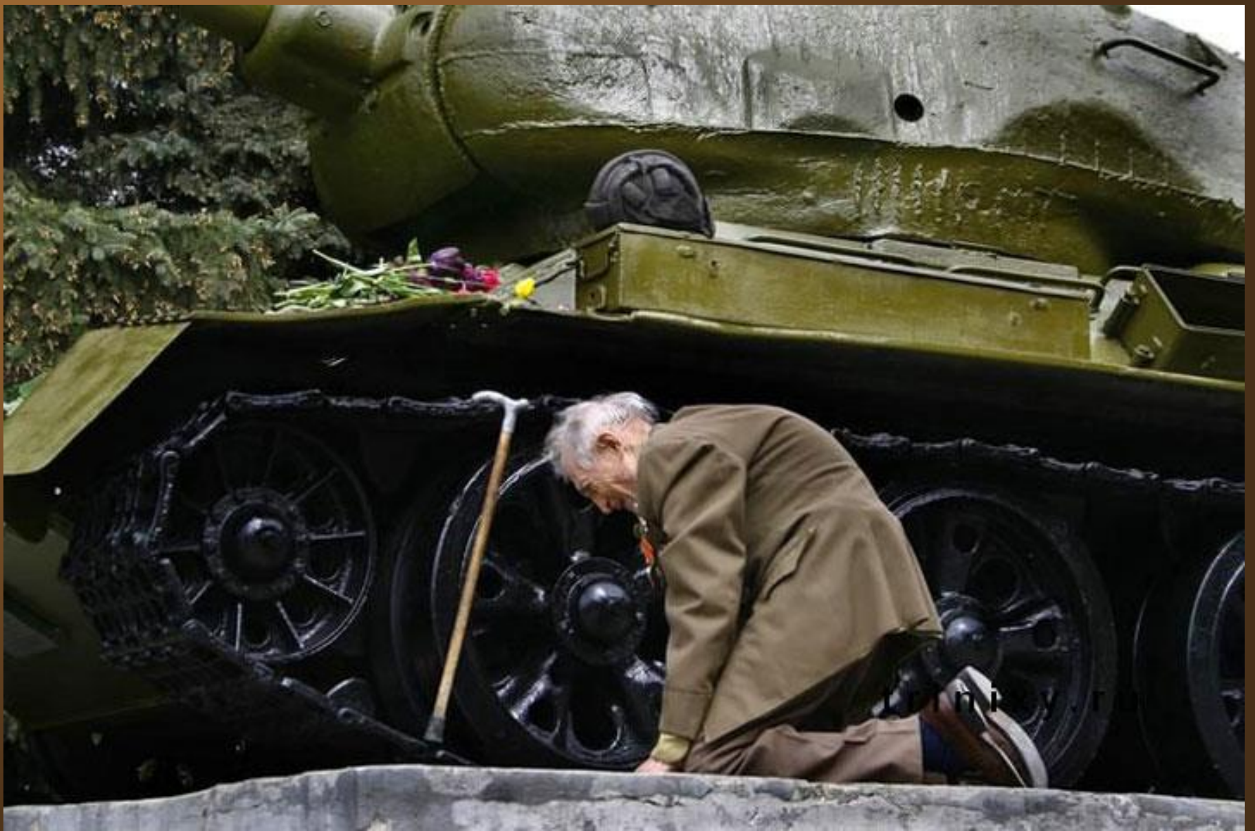
19. Un ancien tankiste russe retrouvant le char dans lequel il a traversé la seconde guerre mondiale