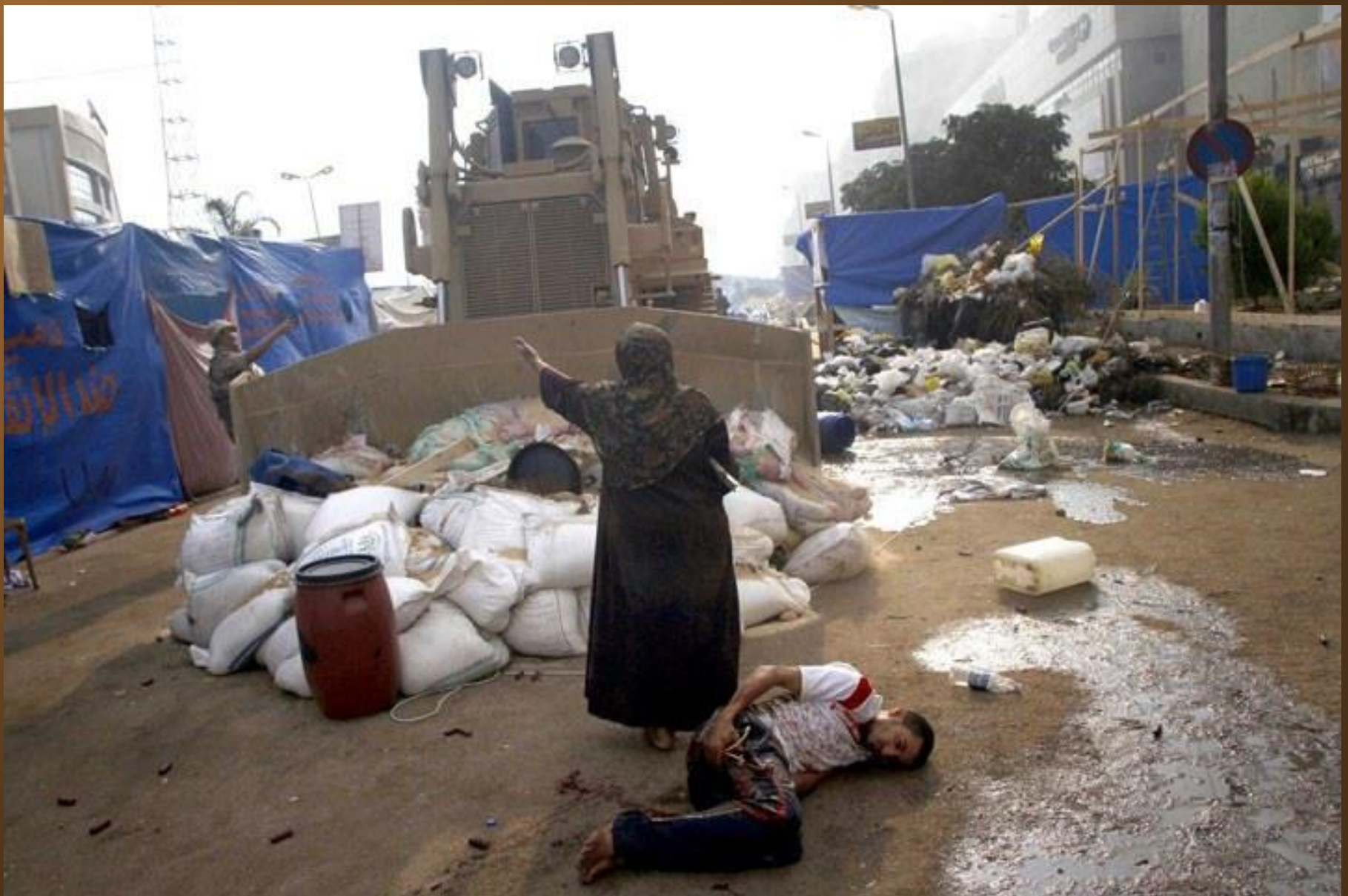
34. Une femme empêche un bulldozer militaire de rouler sur un homme blessé au Caire en Égypte