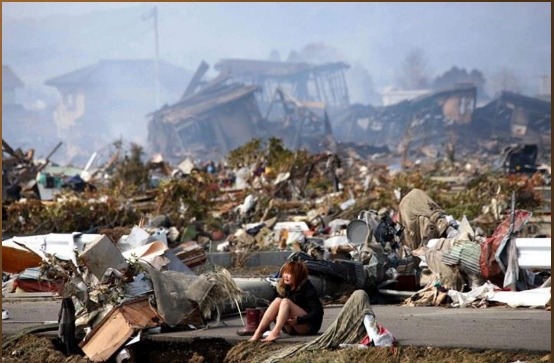
21. Une femme assise au milieu des décombres à Natori après le tremblement de terre et le tsunami qui ont dévasté le Japon en 2011