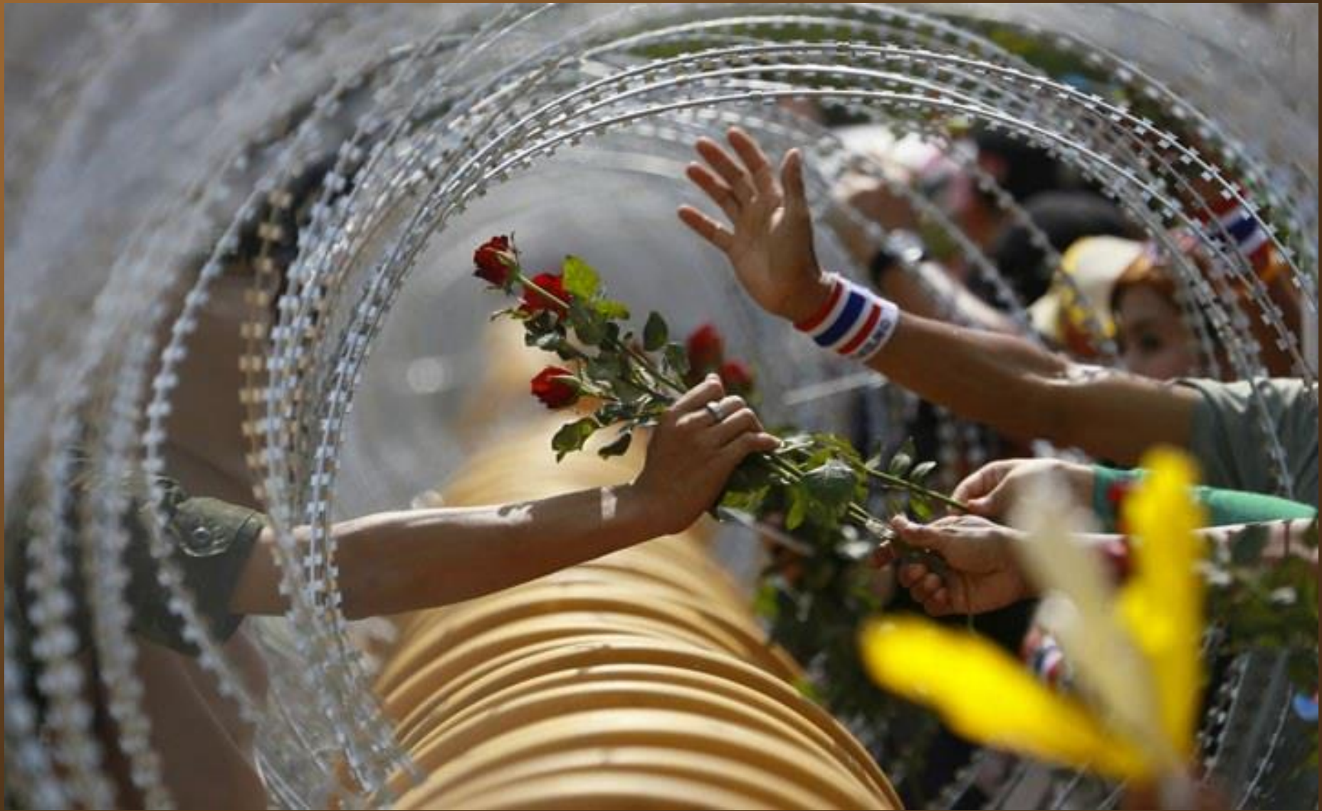
24. Un protestant anti-gouvernemental offre une rose à un soldat à Bangkok