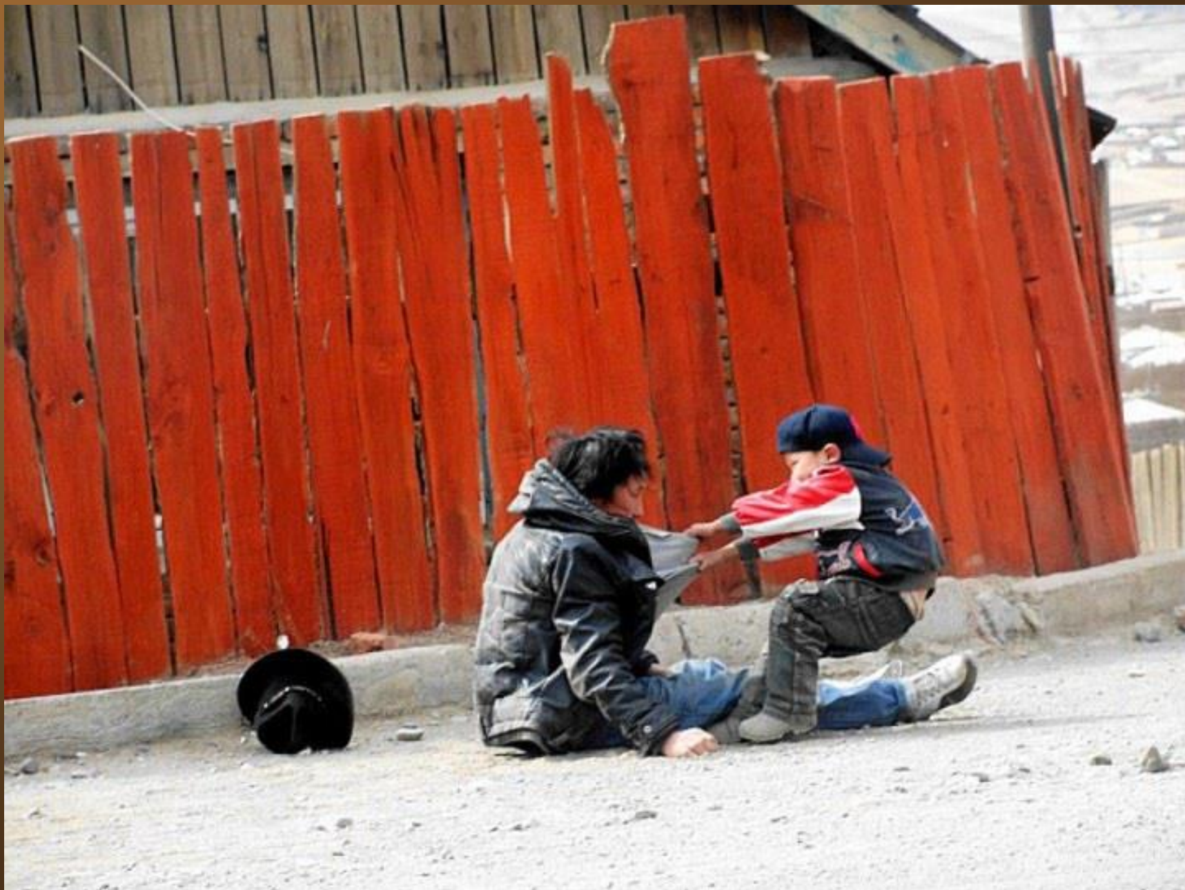
14. Un père alcoolique et son fils