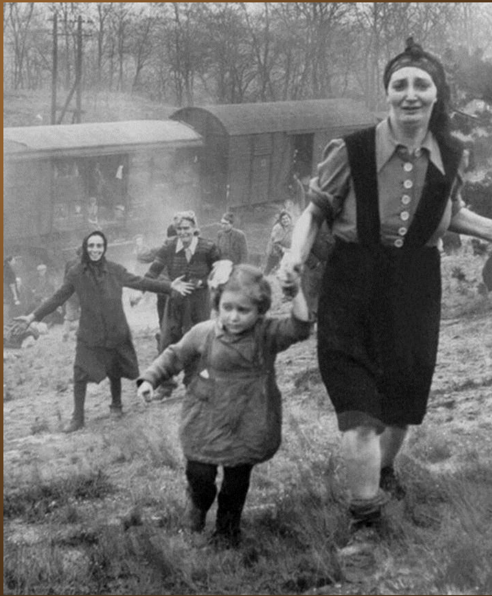
27. Des prisonniers juifs libérés d'un « train de la mort » les conduisant dans un camp de concentration en 1945