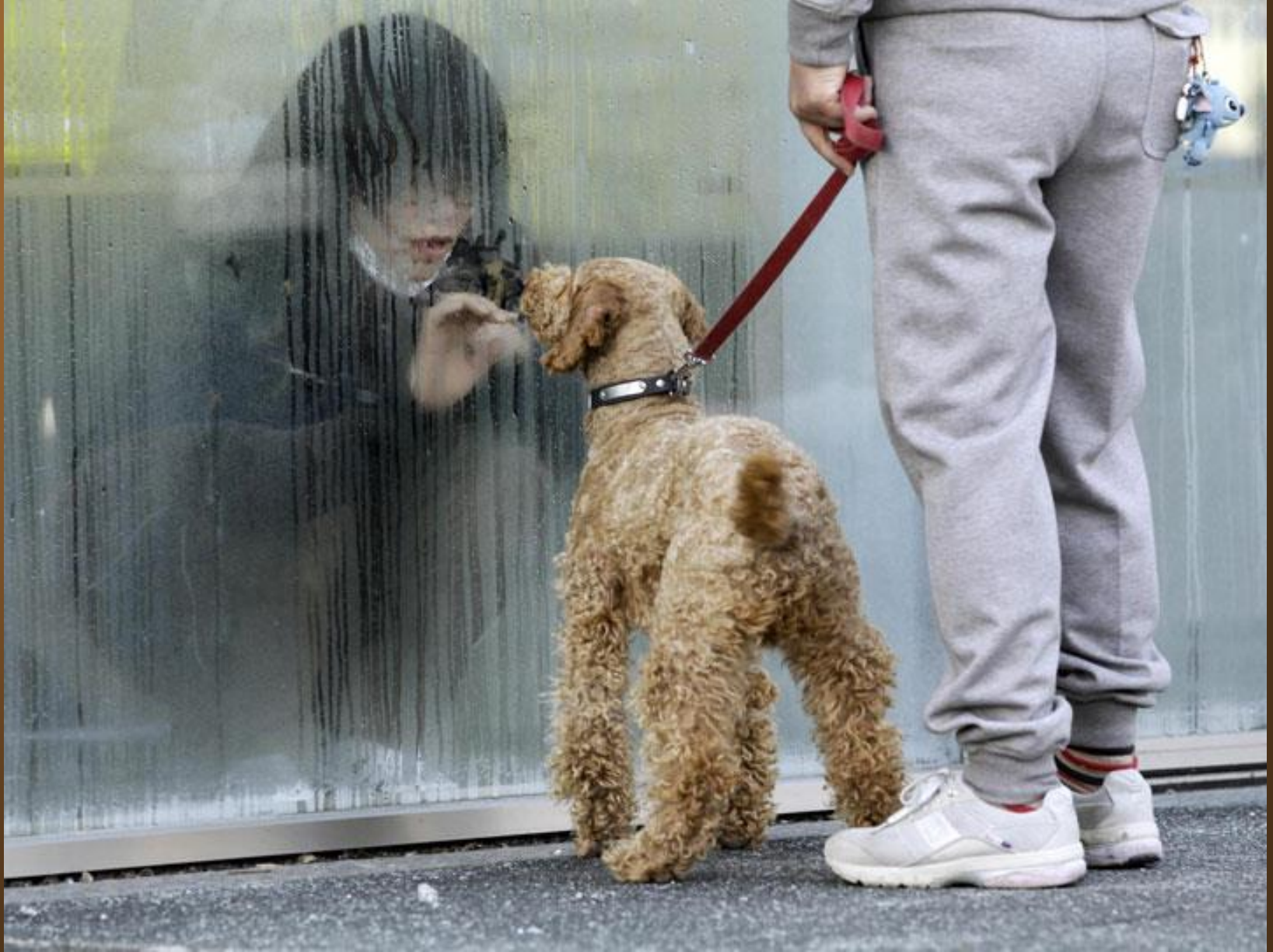
38. Une femme soumise à des radiations regarde son chien à travers une fenêtre à Nihonmatsu au Japon