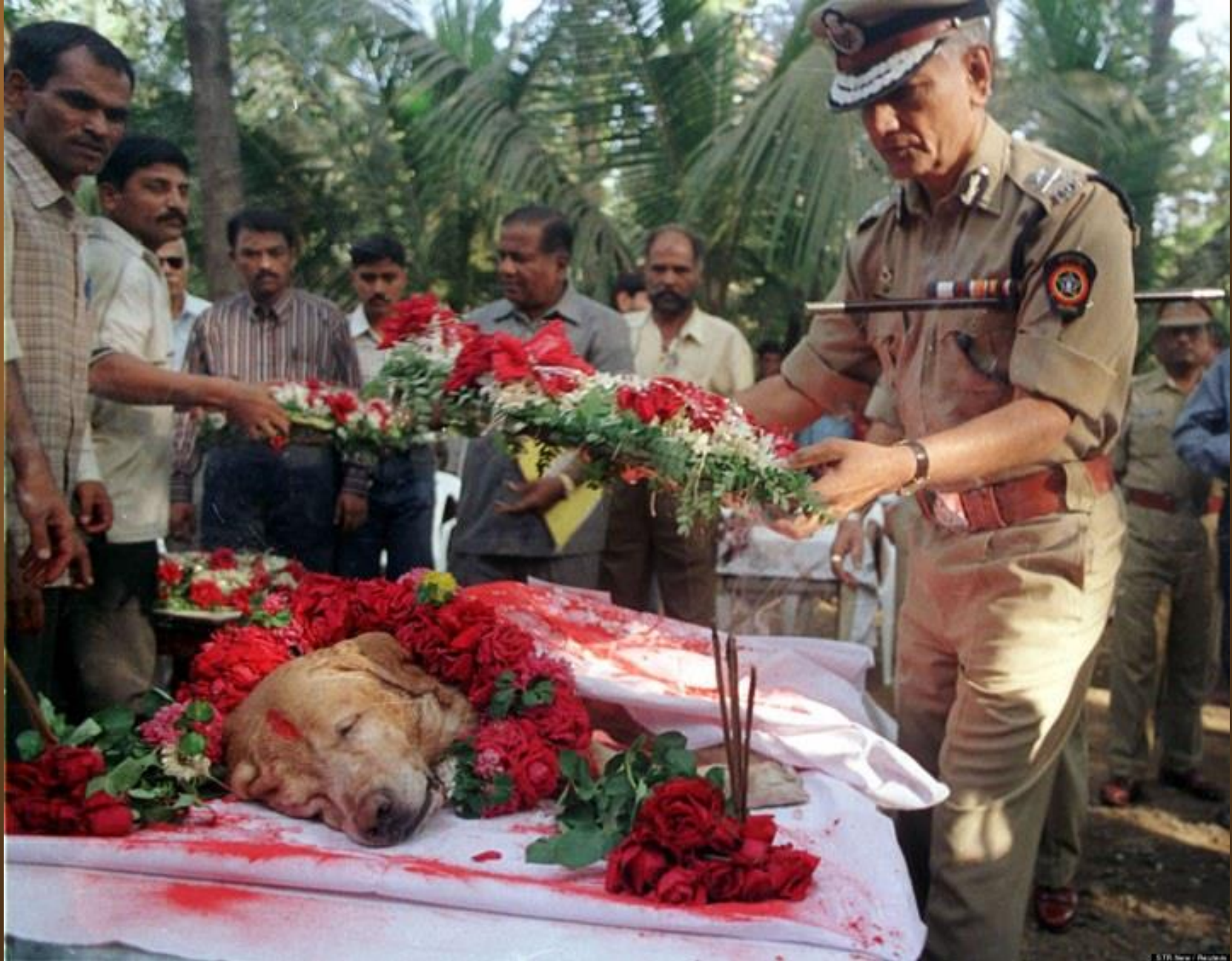
12. Les funérailles majestueuses de Zanjeer, le chien qui a sauvé des milliers de vies durant les explosions de 1993 à Mumbai, en Inde