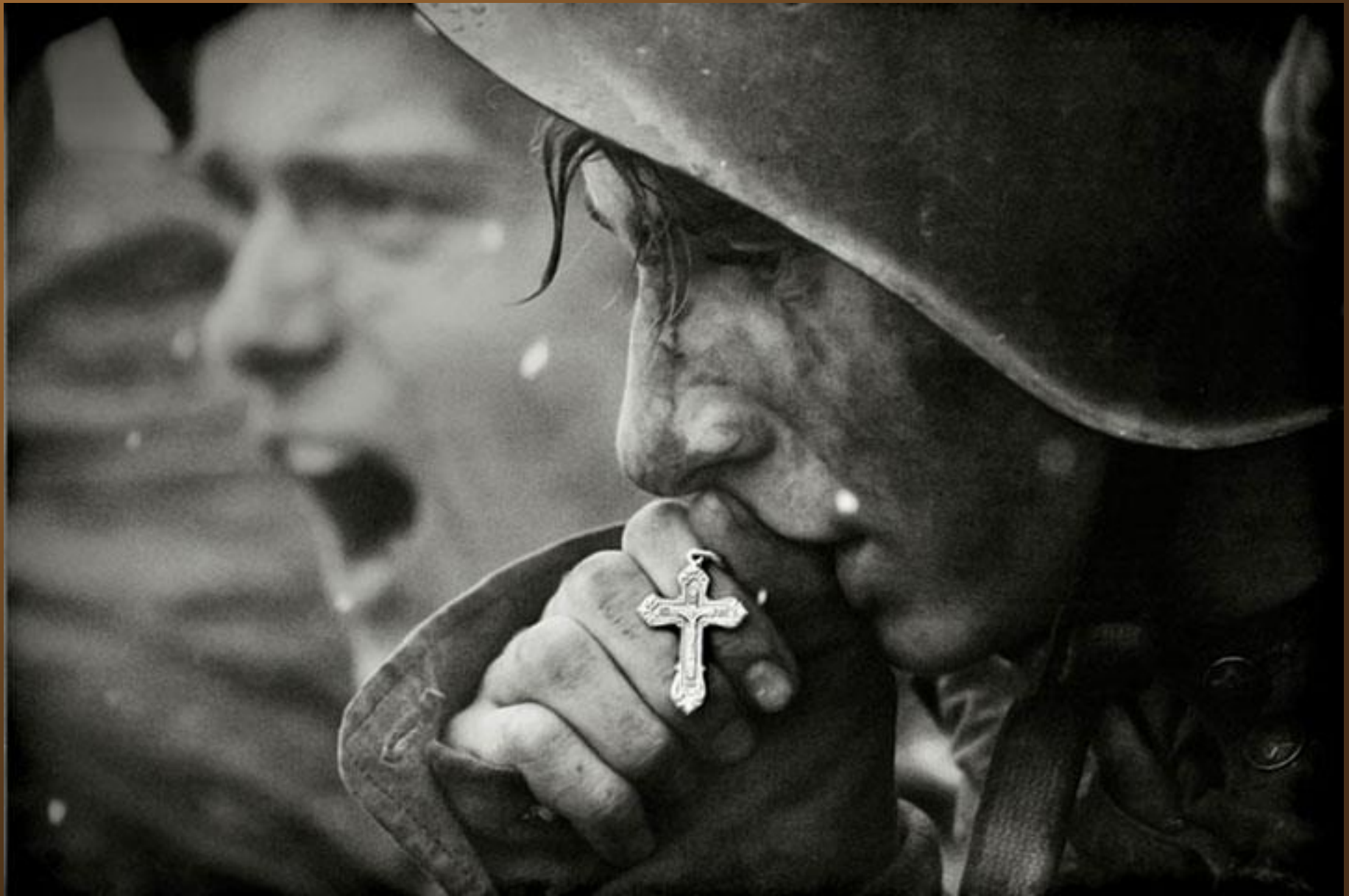
25. Des soldats russes se préparant pour la bataille de Kursk en Juillet 1943 (photo créée en 2006 à partir d'archives)