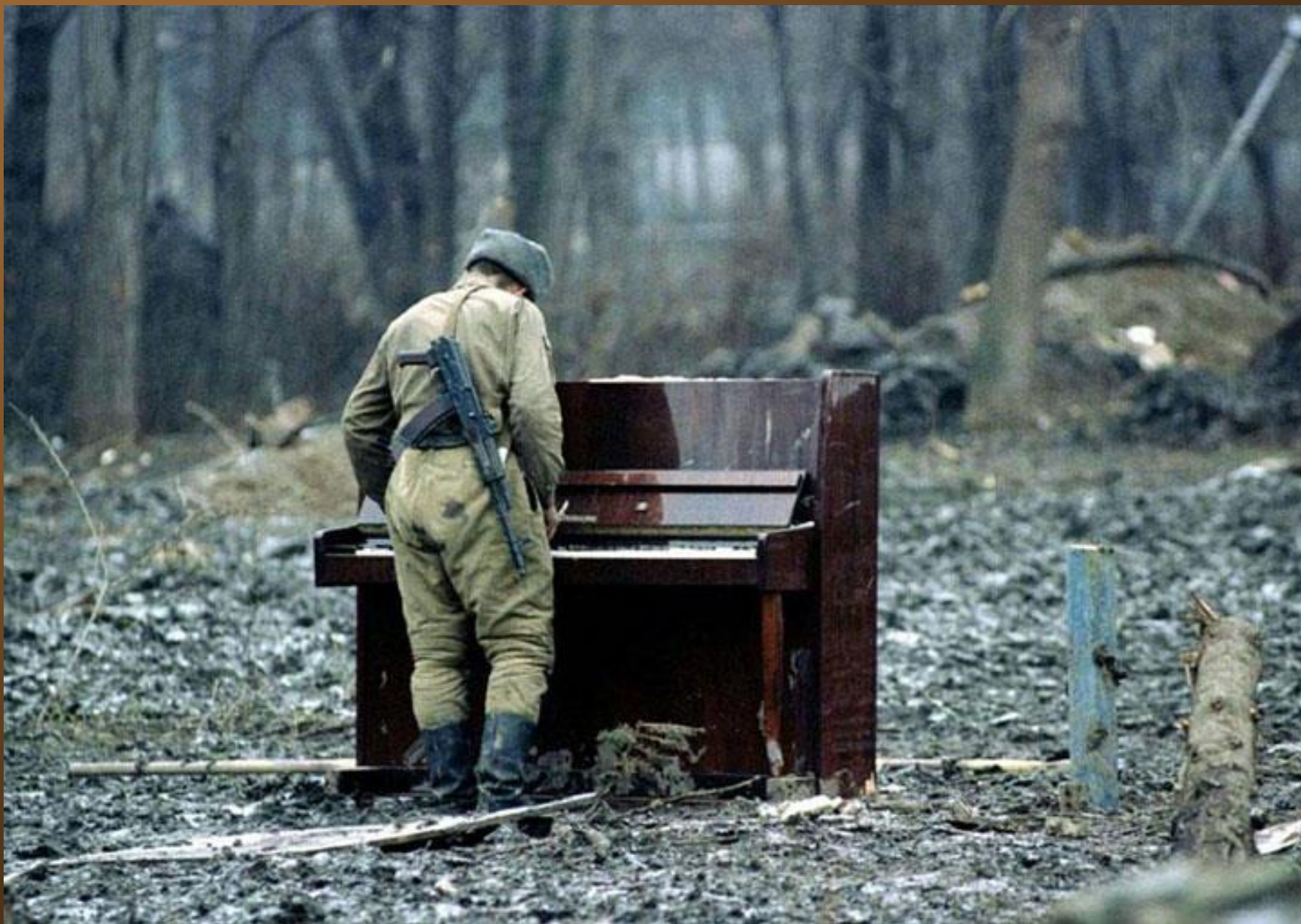
5. Un soldat russe jouant du piano au milieu de nulle part à Chechnya en 1994