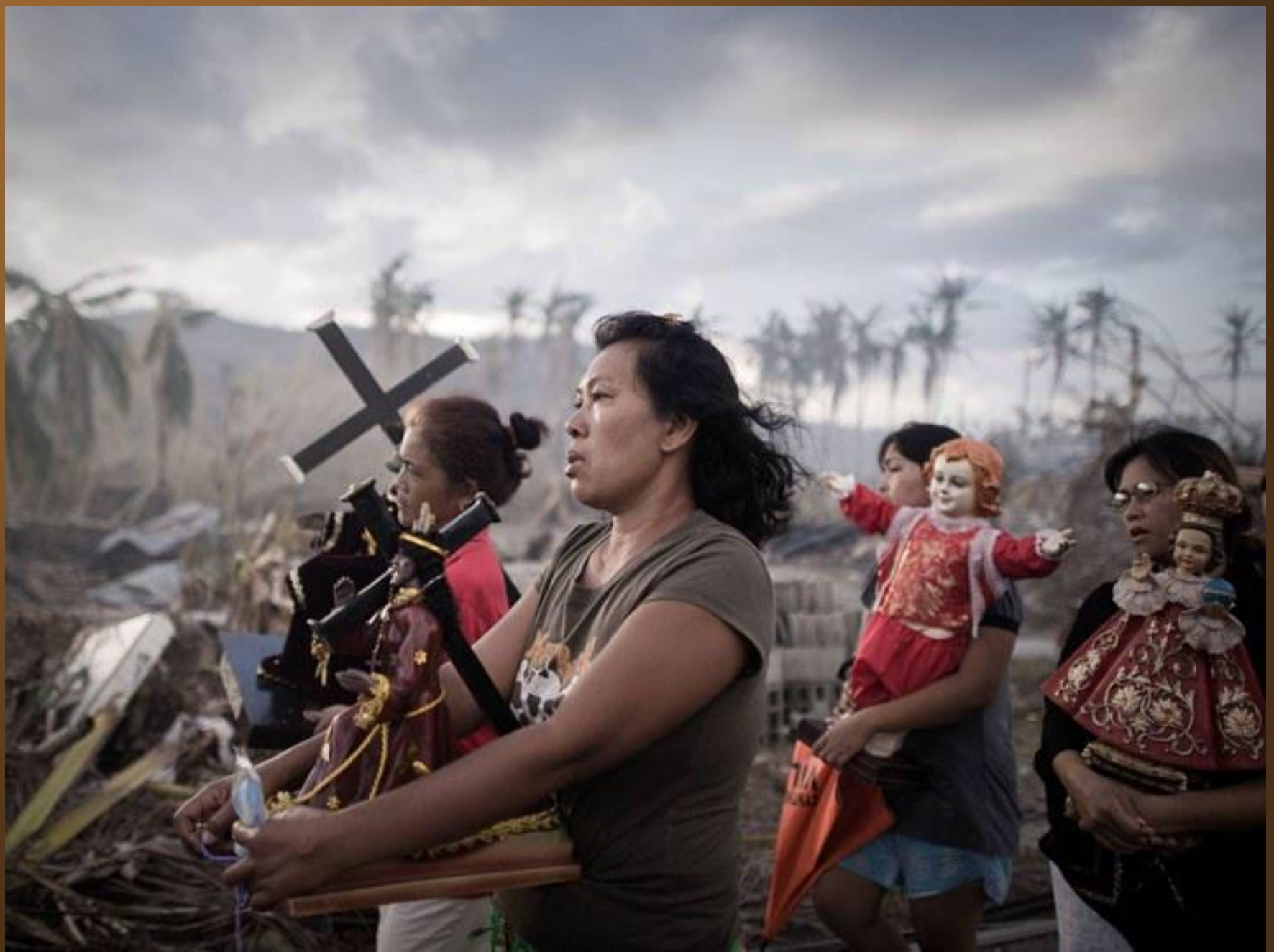
32. Des survivants de la tornade Haiyan entament une procession religieuse