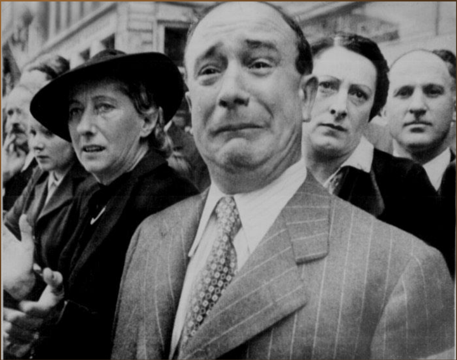
28. Un civil français pleurant de désespoir alors que les Nazis prennent le contrôle de Paris pendant la Seconde Guerre Mondiale