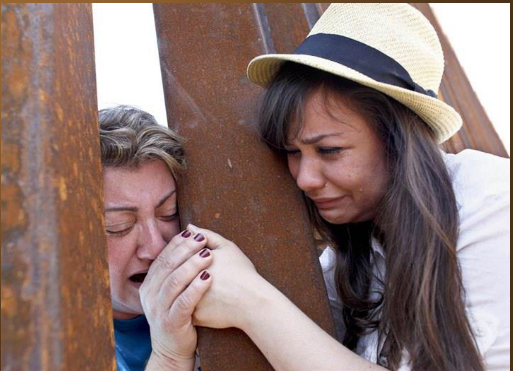
13. Une fille tenant la main de sa mère 6 ans après que cette dernière ait été déportée dans son pays natal. Elles sont séparées par la barrière qui symbolise la frontière entre l'Arizona et le Mexique.