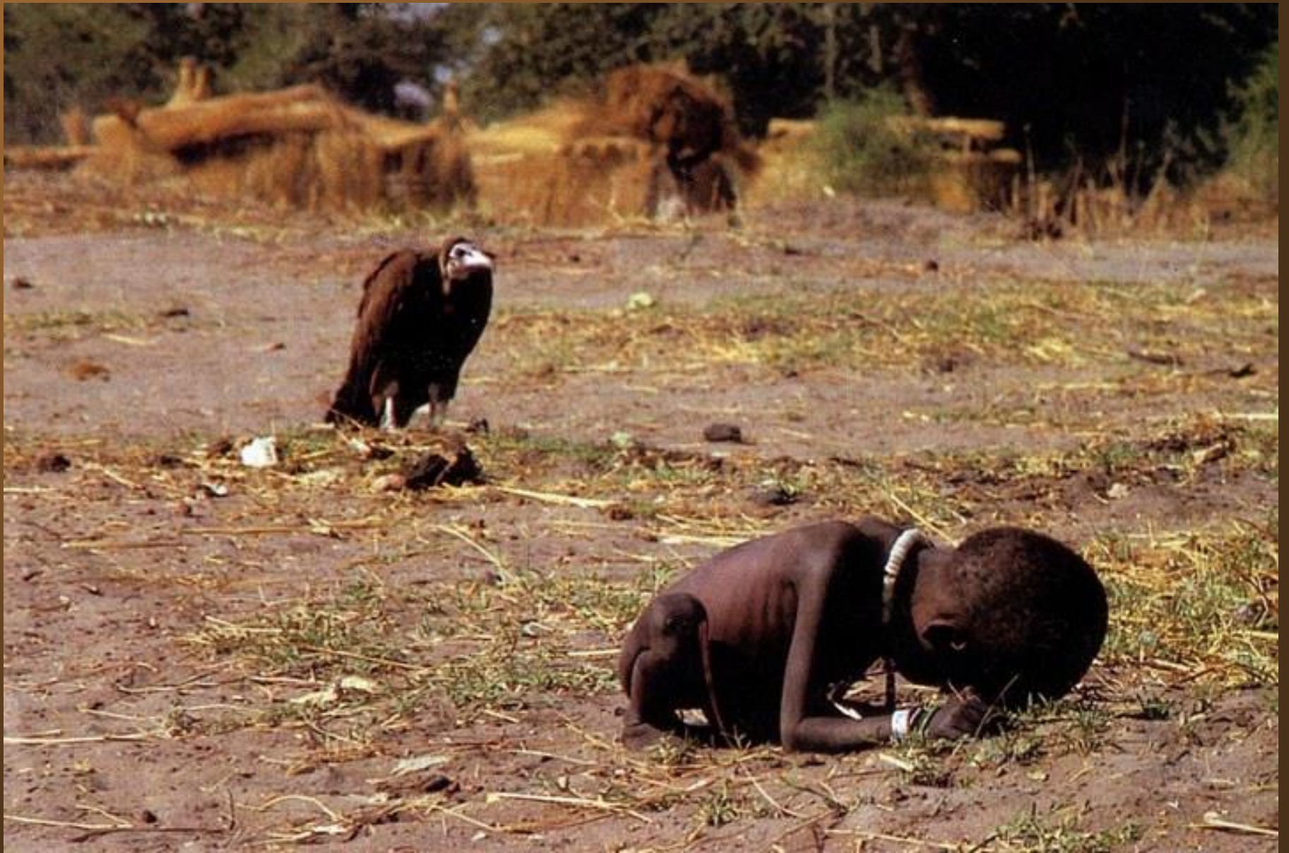
6. Une fillette soudanaise épiée par un vautour