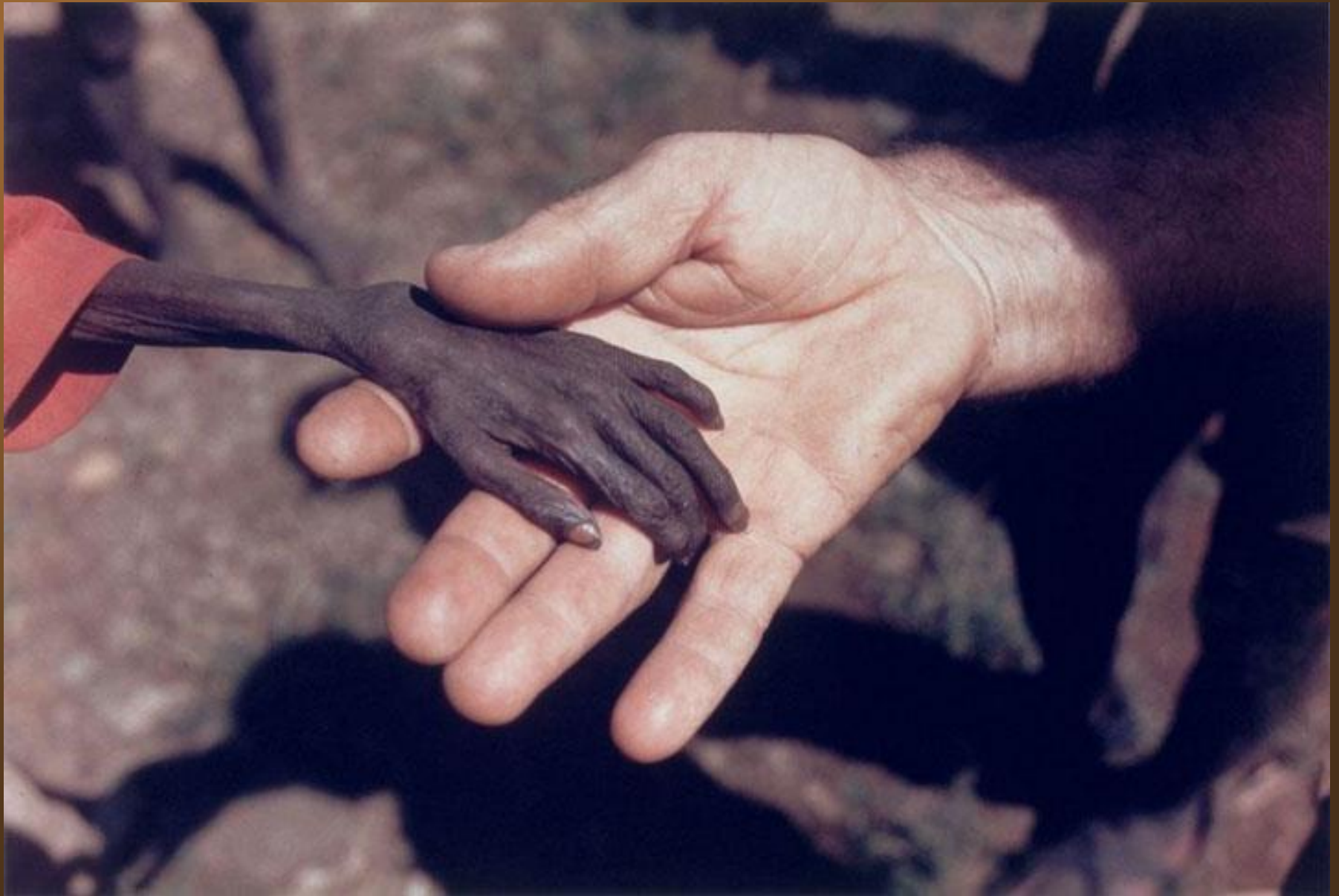
1. Un petit garçon affamé donne la main à un missionnaire