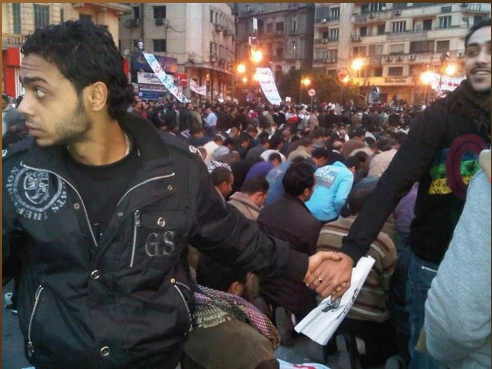
8. Des chrétiens protégeant des musulmans pendant leur prière durant les émeutes du Caire en 2011