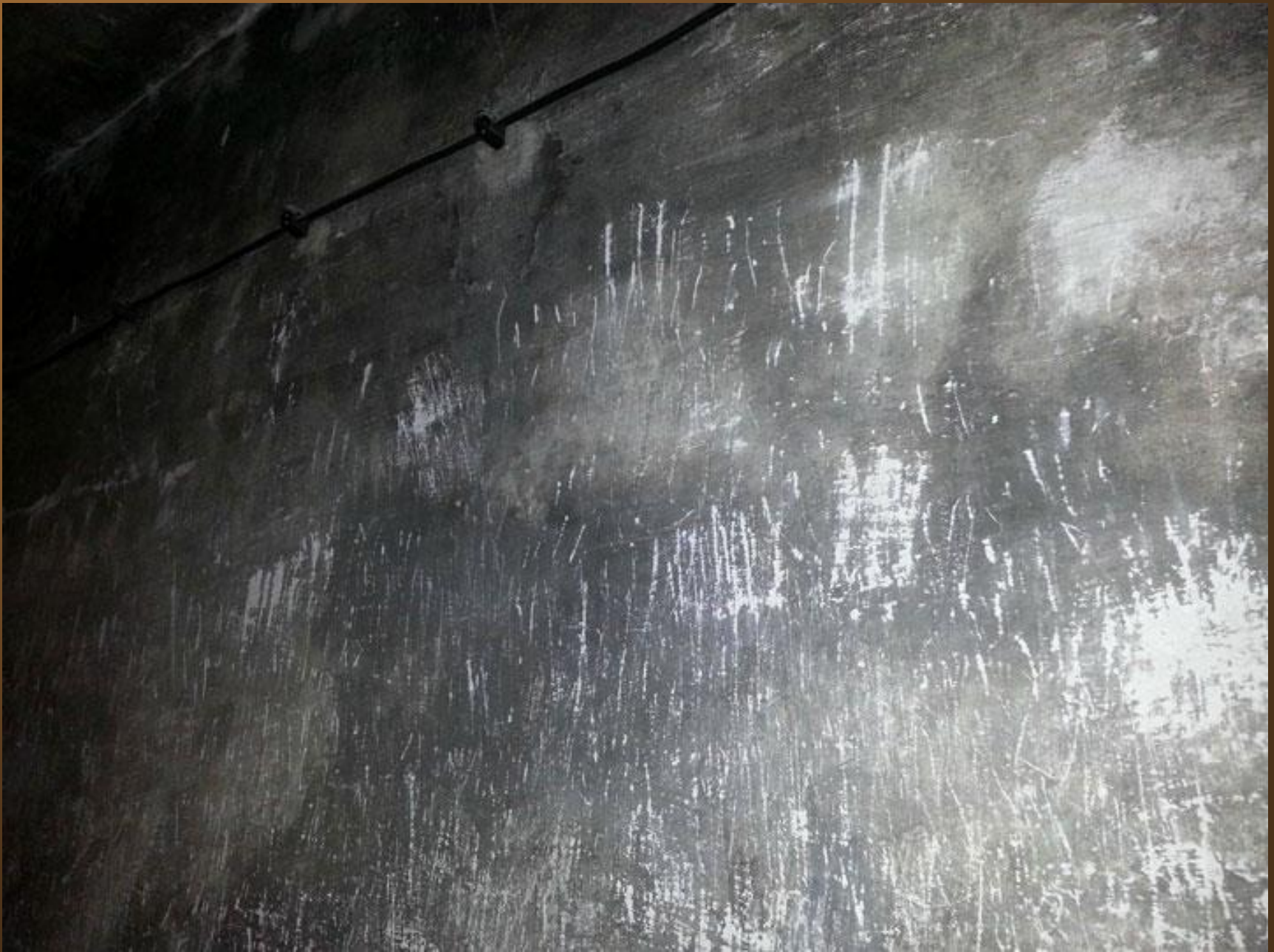
2. L'intérieur d'une chambre à gaz du camp de concentration d'Auschwitz