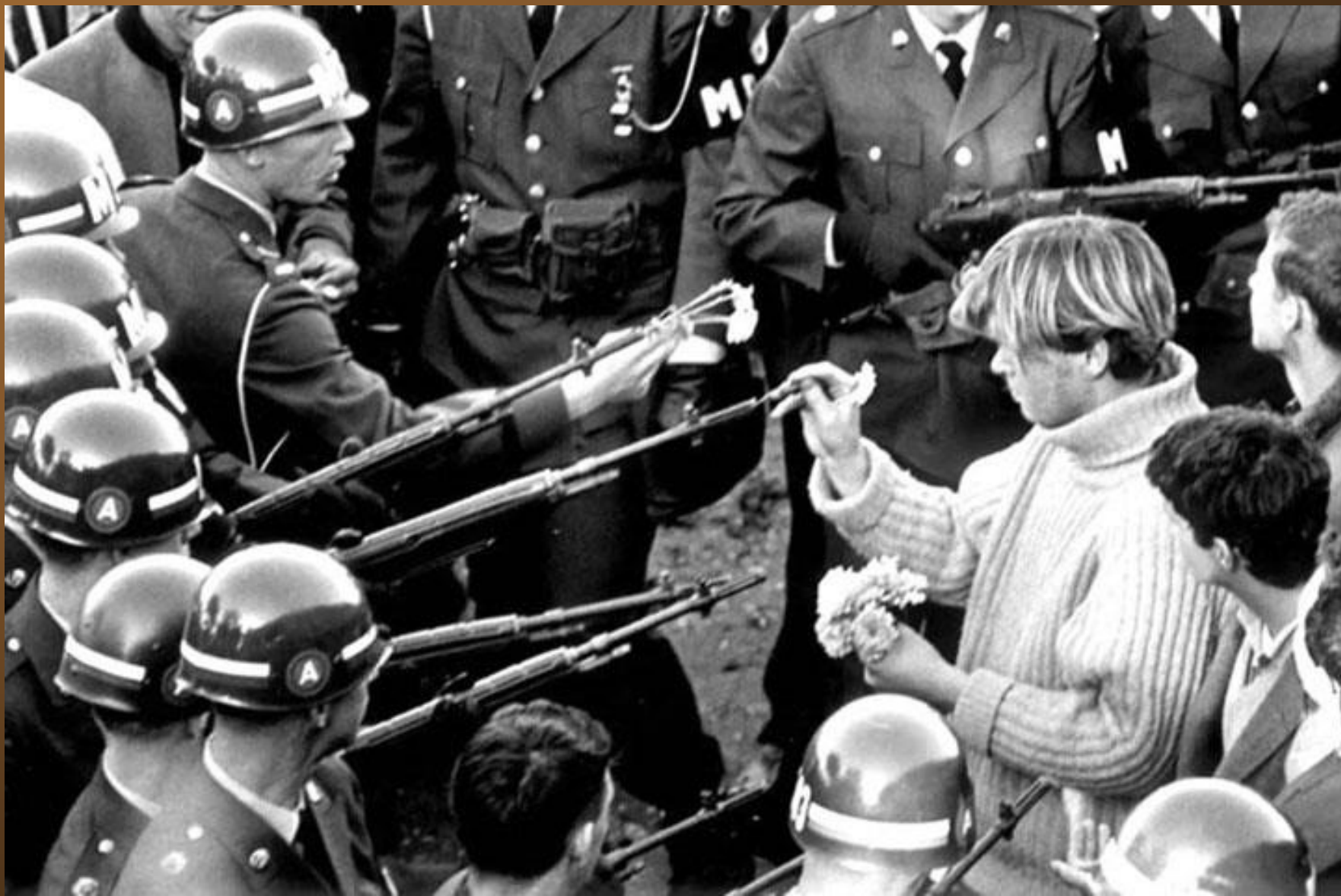
20. Un manifestant mettant des fleurs au bout des armes des forces de l'ordre. Cette photo a été prise le 21 octobre 1967 durant la marche pour la Manifestation du Pentagone.