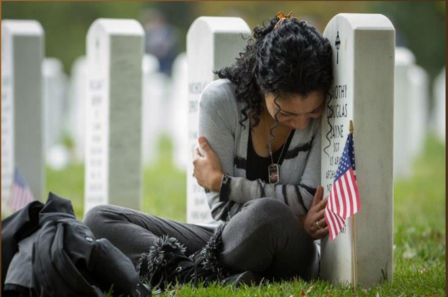
35. Une veuve pleure sur la tombe de son défunt mari, tombé au Pakistan