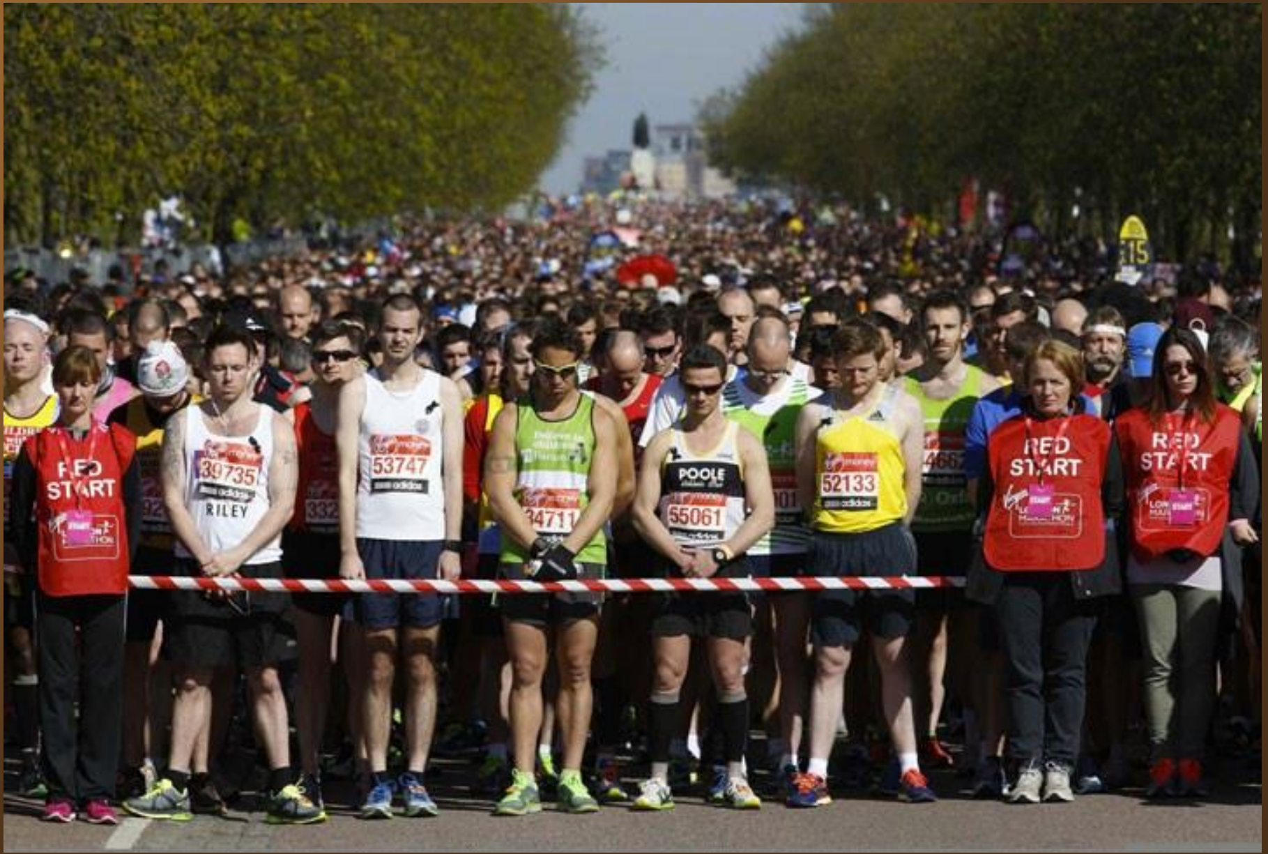
18. Les participants du marathon de Londres effectuant une minute de silence en l'honneur des blessés de l'attentat du marathon de Boston