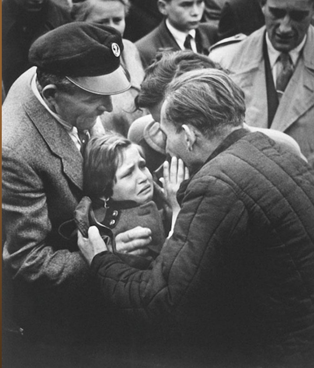
36. Un prisonnier allemand de la Seconde Guerre mondiale réuni à sa fille. L'enfant n'avait pas vu son père depuis l'âge de un an.