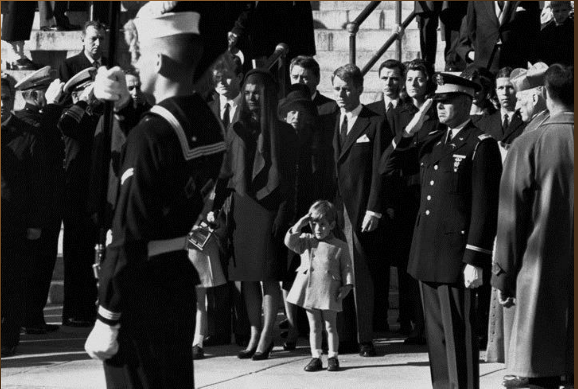
40 John F. Kennedy Jr. salue le cercueil de son père avec la garde d'honneur