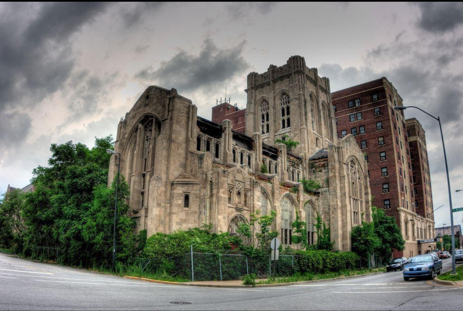
La cathédrale abandonnée de Gary, Indiana, Etats-Unis