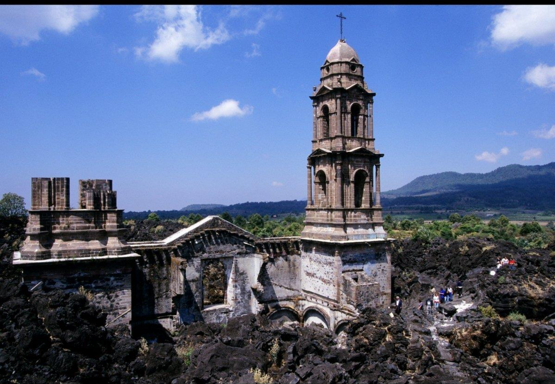
San Juan Parangaricutiro, Mexique - Une ville dévastée par un volcan