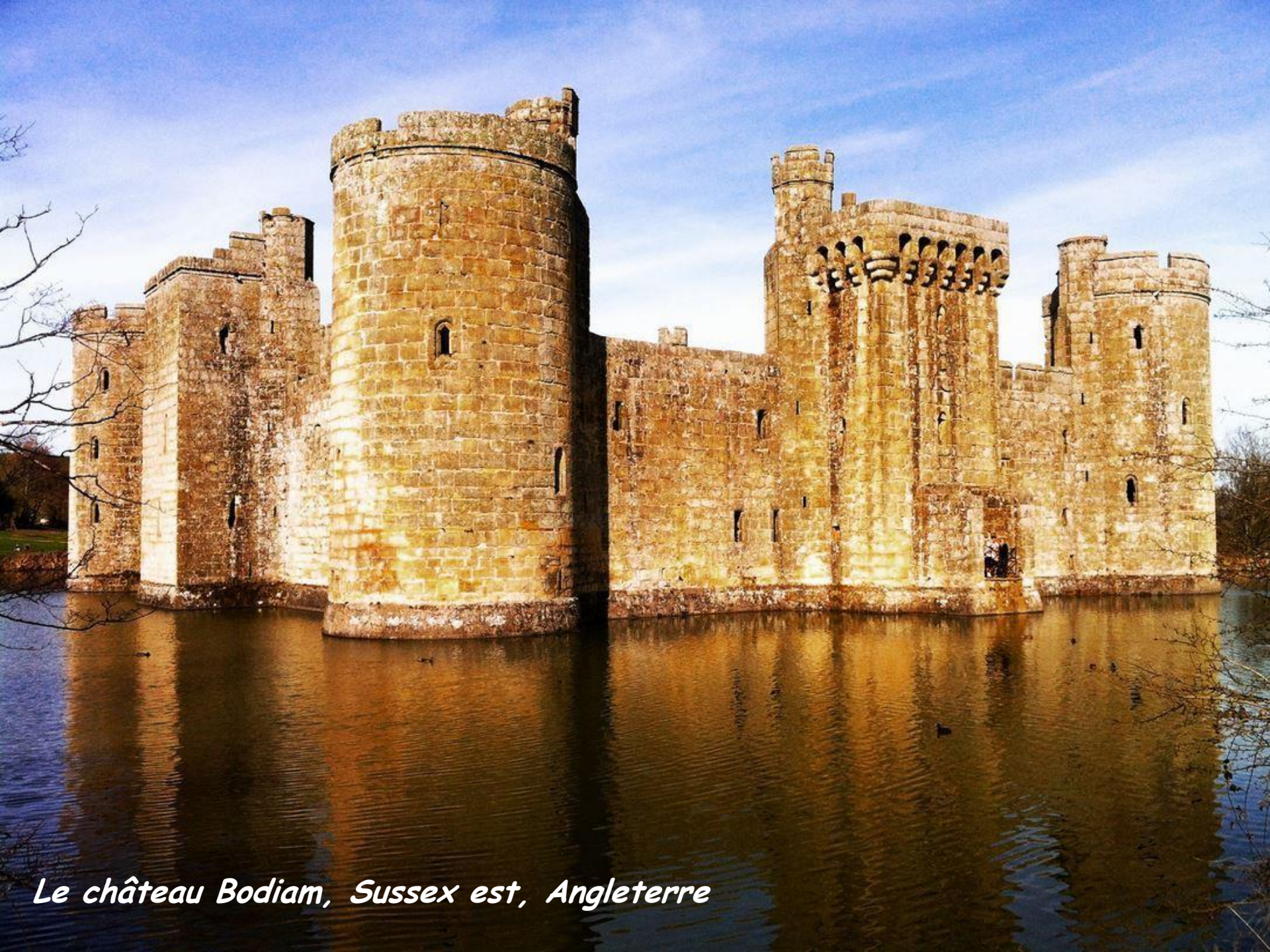
Le château Bodiam, Sussex est, Angleterre