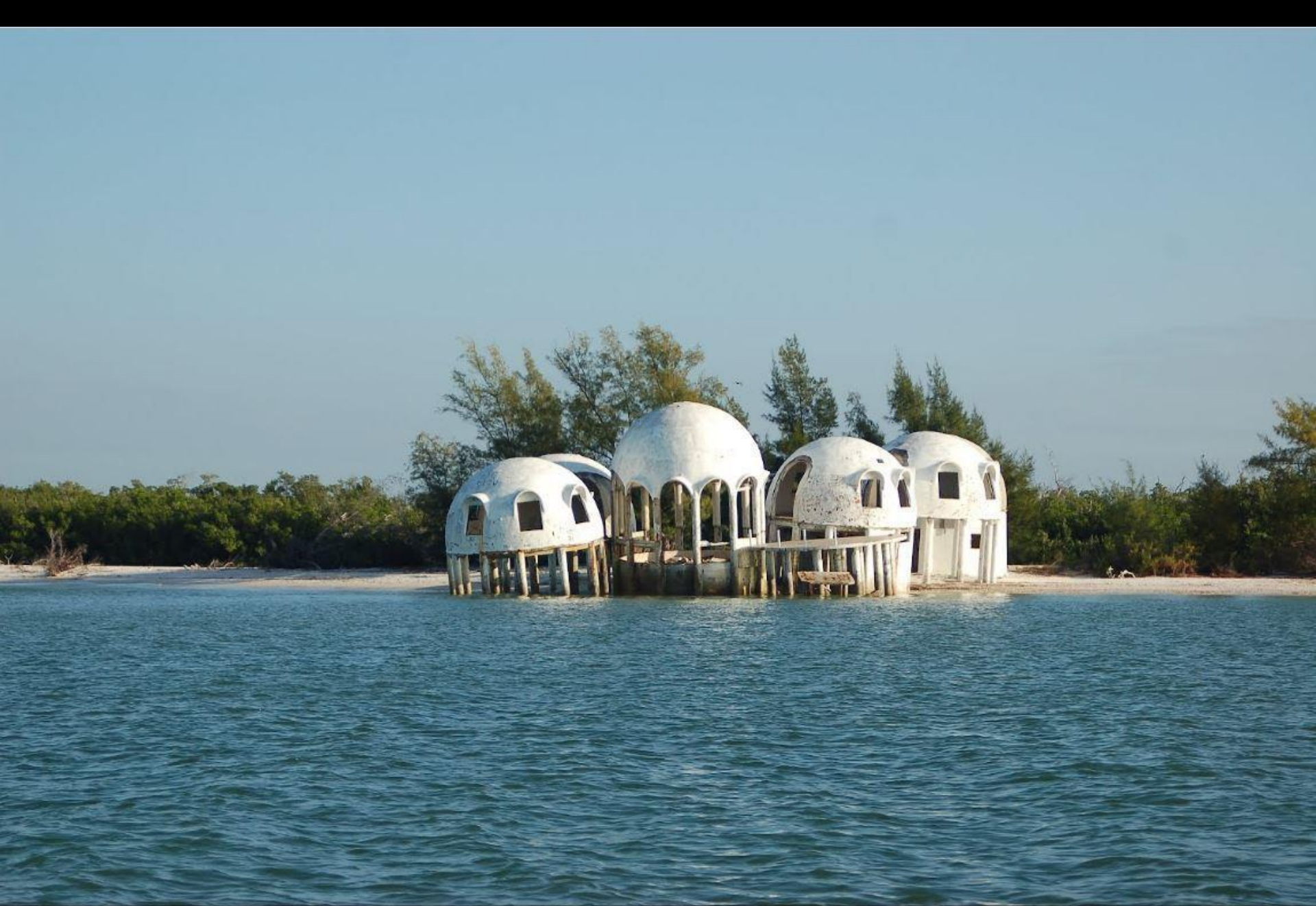
Les maisons "dômes" abandonnées, Cap Romano, Floride