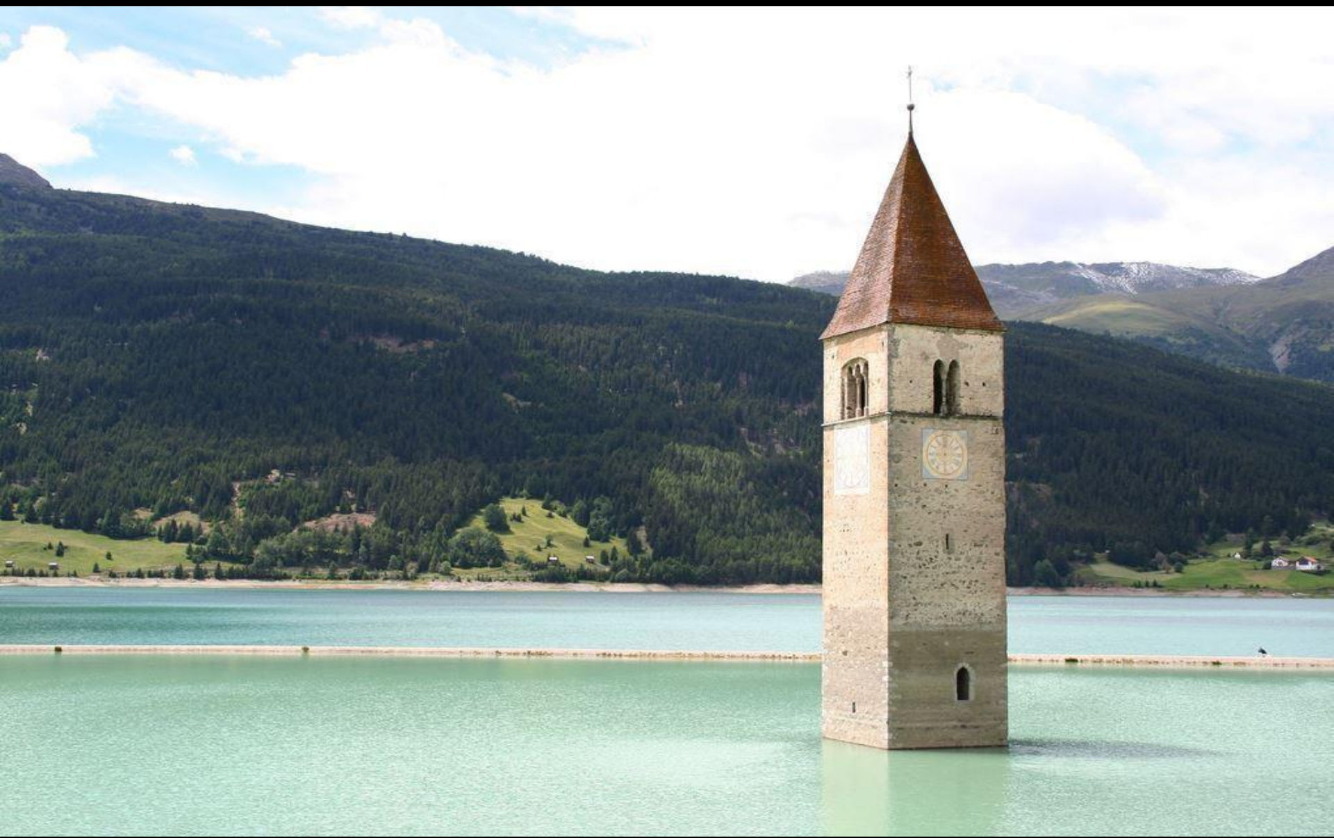
Curon, village immergé en Italie Le Clocher de Curon, sur le lac Resia au Val Venosta, au dessus du village immergé de Curon.