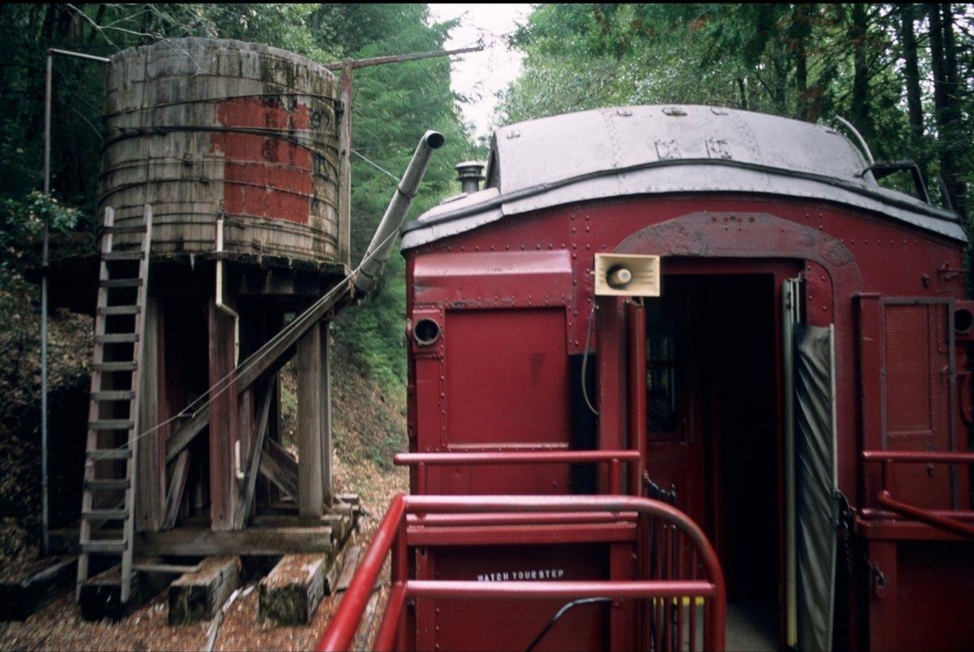
Un train de banlieue abandonné en Californie