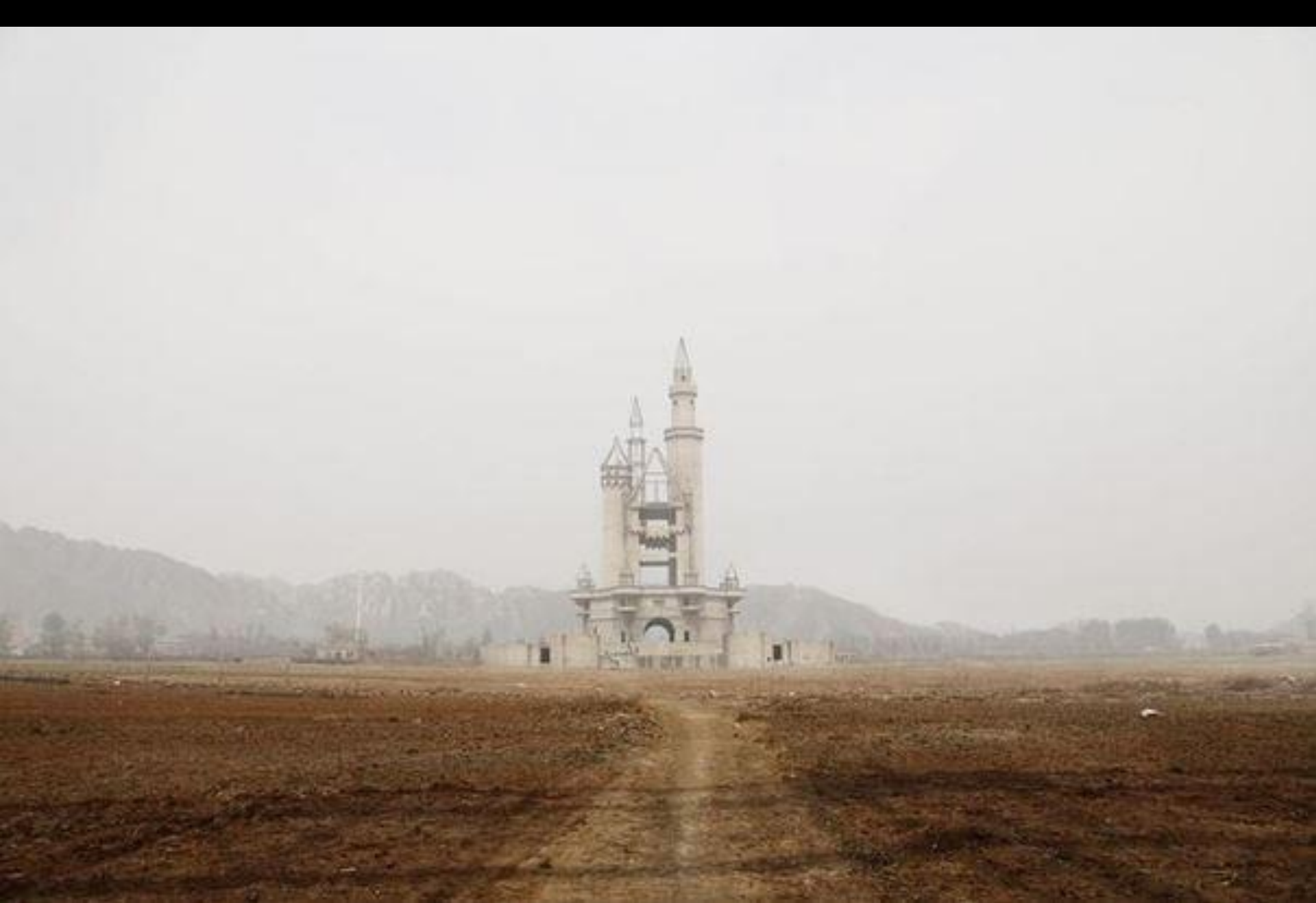
Le parc d'attraction "Wonderland", Pékin, Chine