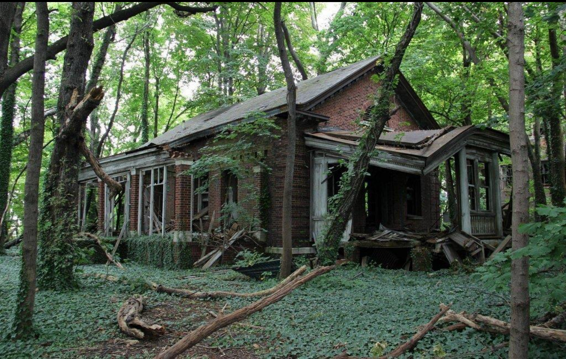
North Brother Island, New York, Etats-Unis. Entre Manhattan et l'aéroport de La Guardia, se trouve North Brother Island, un petit bout de terre entouré par les eaux.