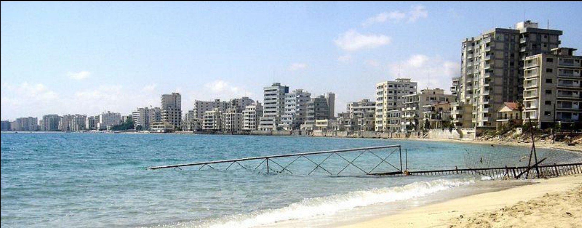
La cité balnéaire de Varosha, Chypre