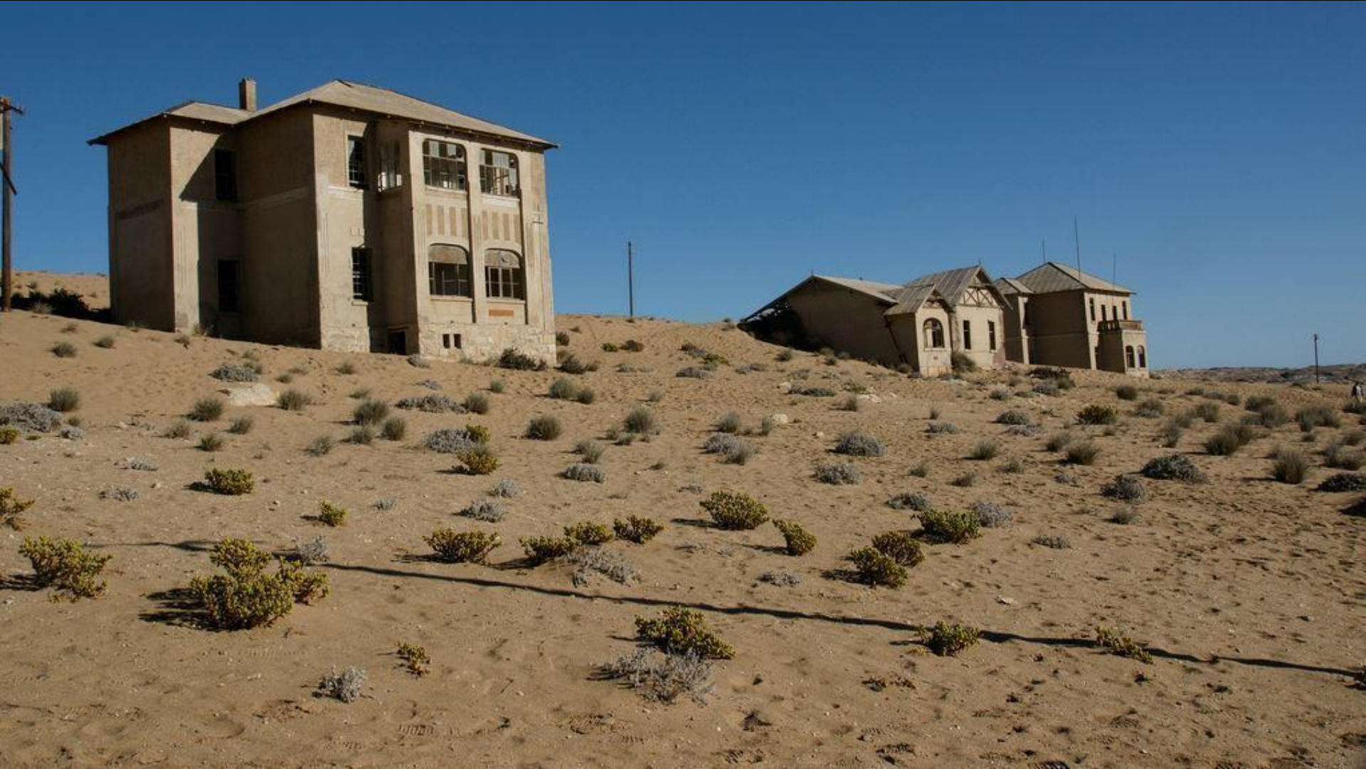
Le village de Kolmannskuppe, Namibie Un village fantôme, envahi par le sable du désert de Namibie.