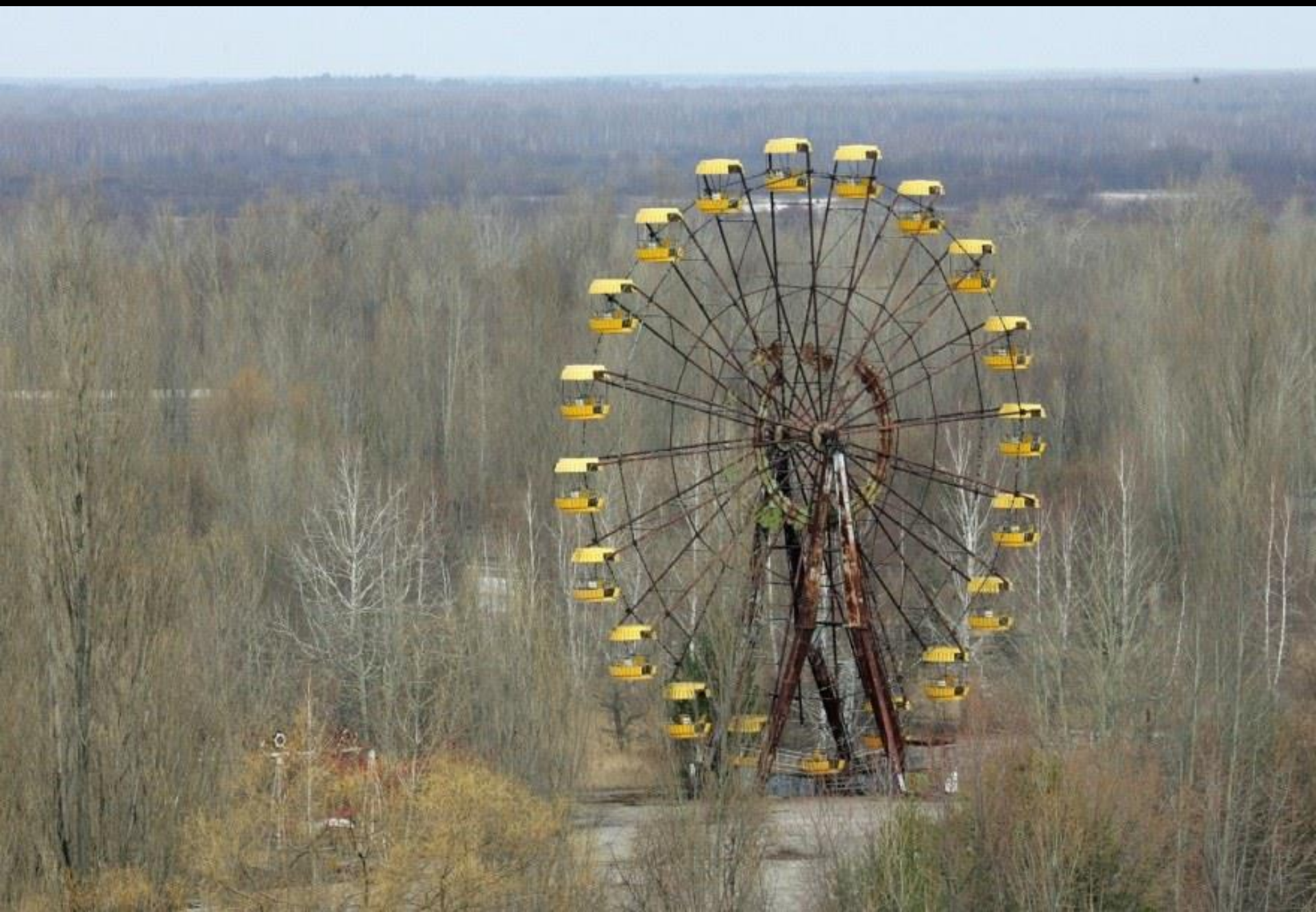
Pripyat, la ville irradiée à 3 km de Tchernobyl, Ukraine