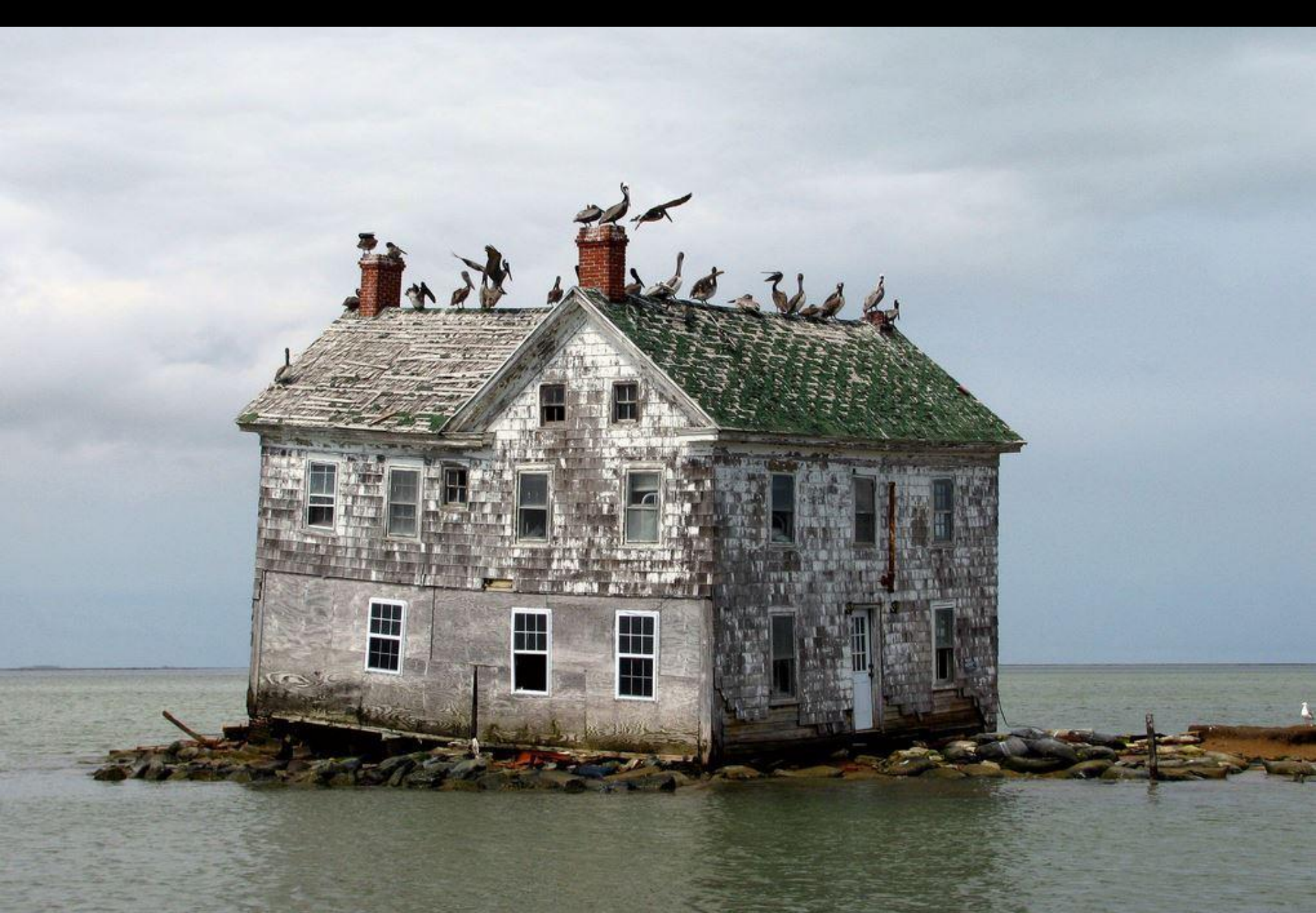
La dernière maison sur Holland Island (Maryland Etats-Unis)