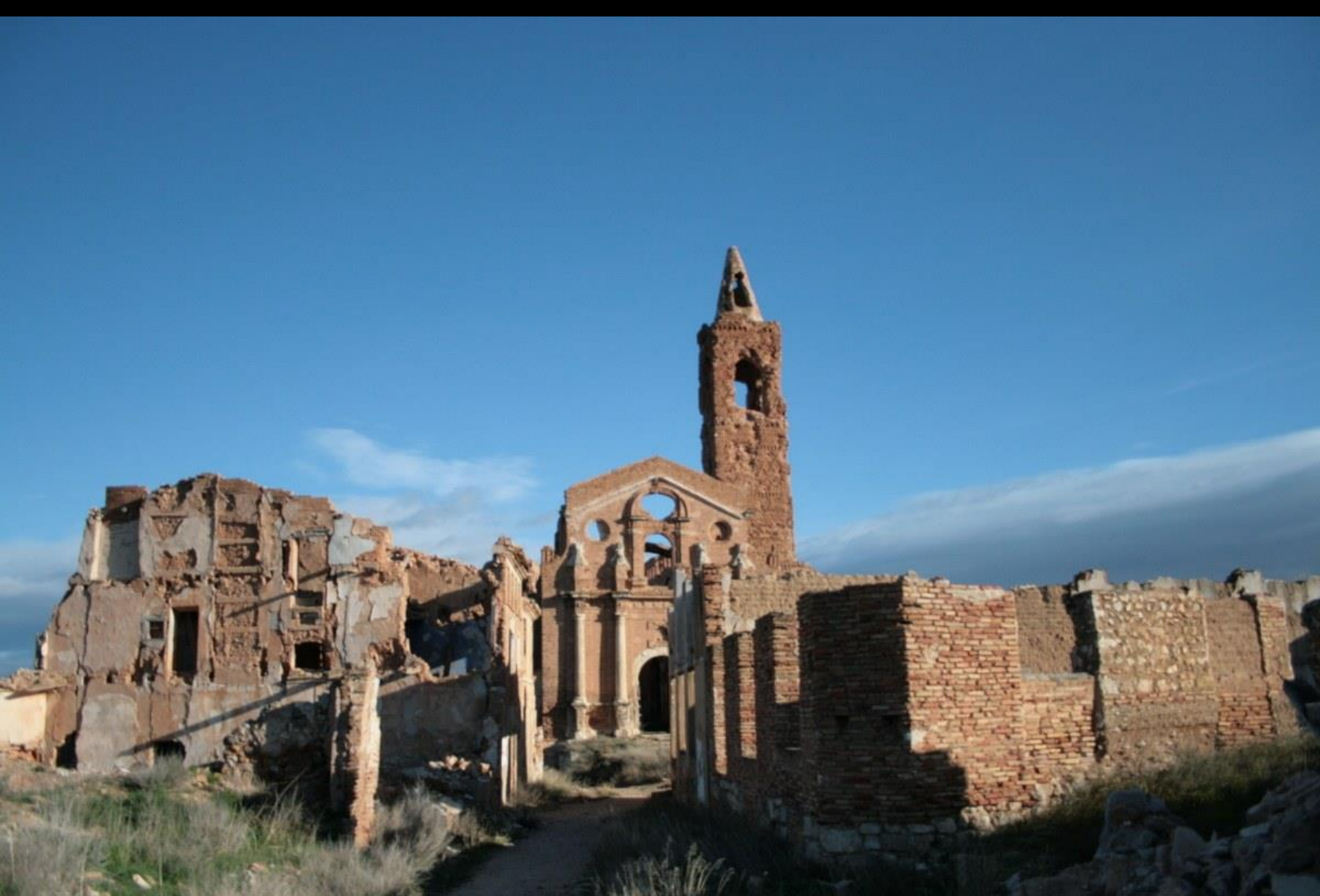
Belchite dans la province de Saragosse en Espagne