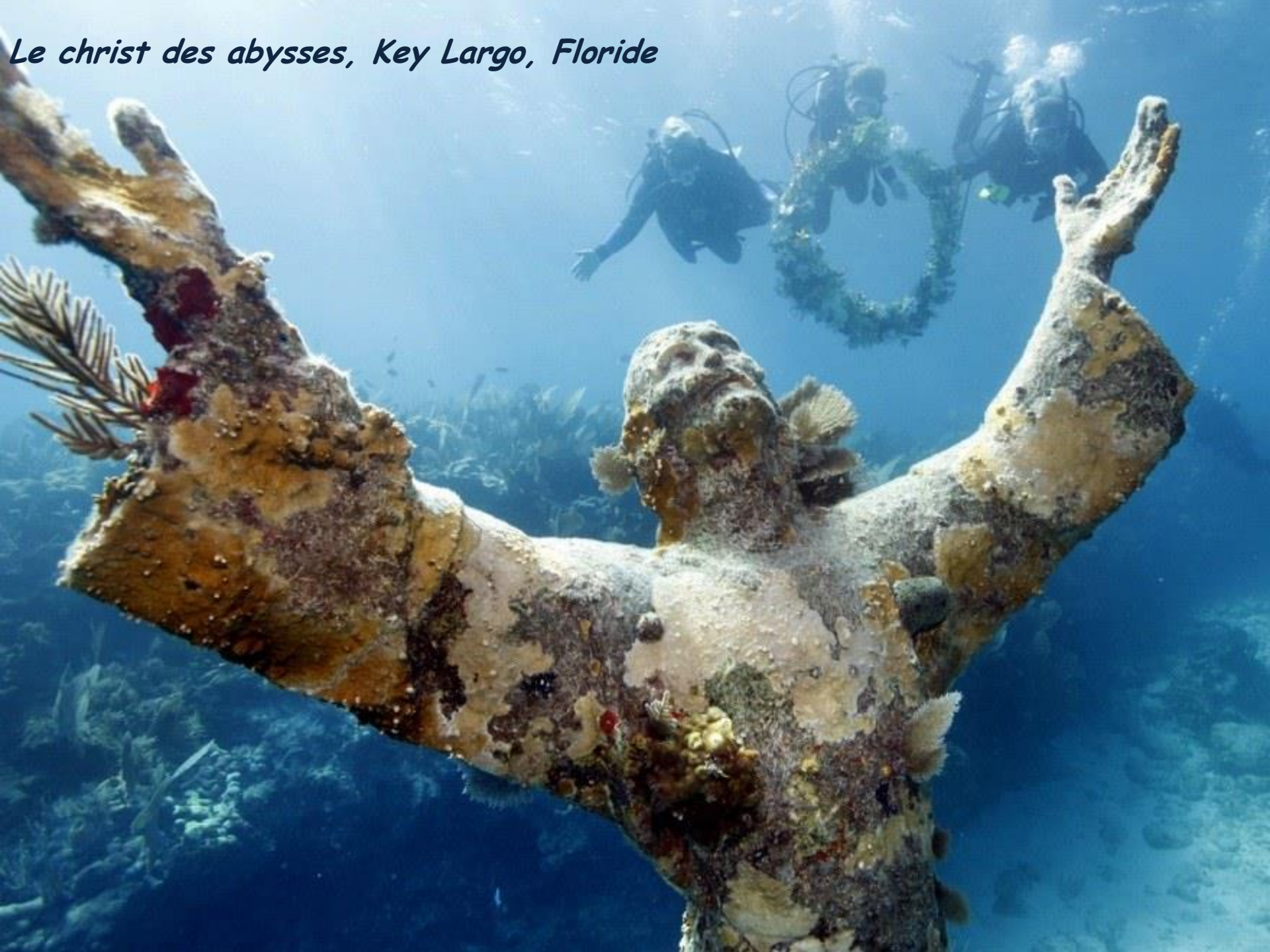
Le christ des abysses, Key Largo, Floride