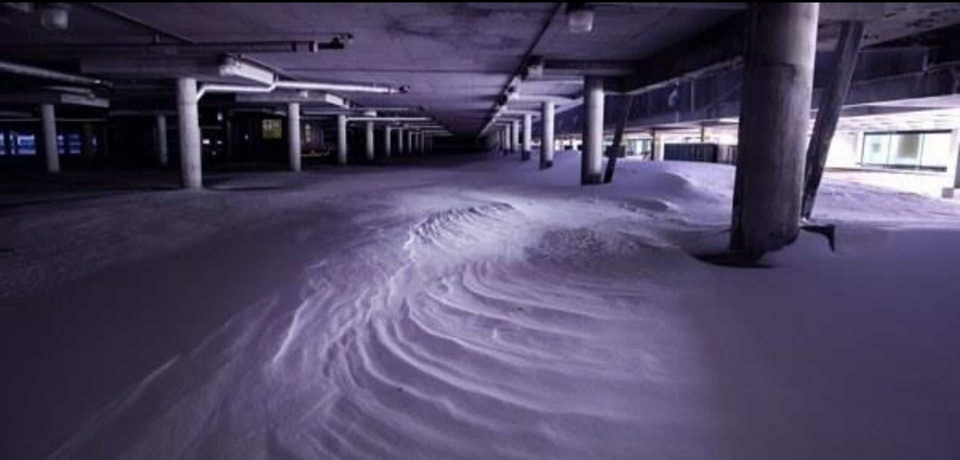
L'aéroport fantôme de Mirabel, près de Montréal