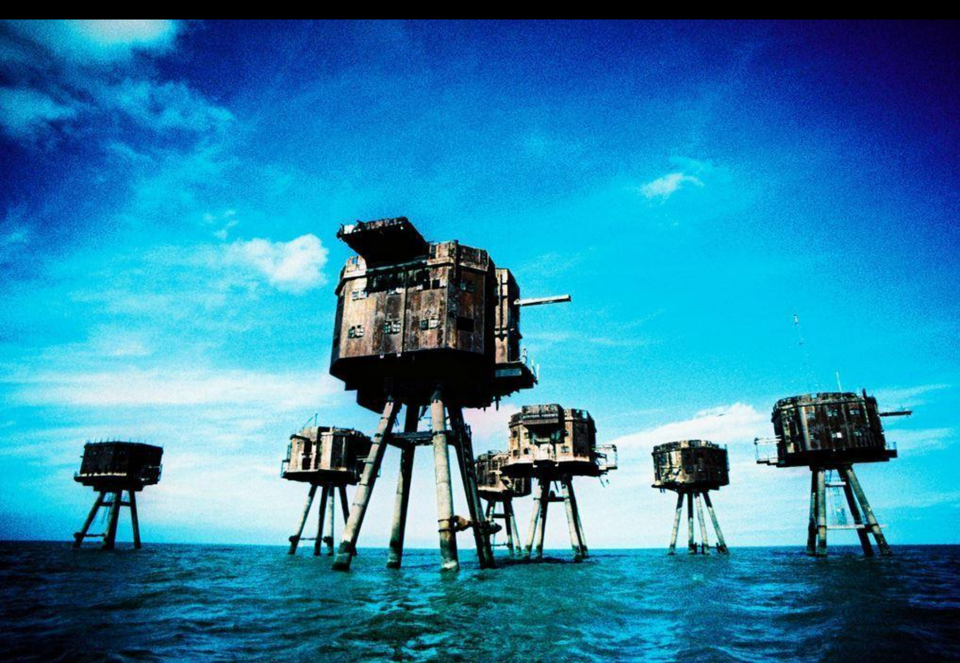
Maunsell Sea Forts, Angleterre