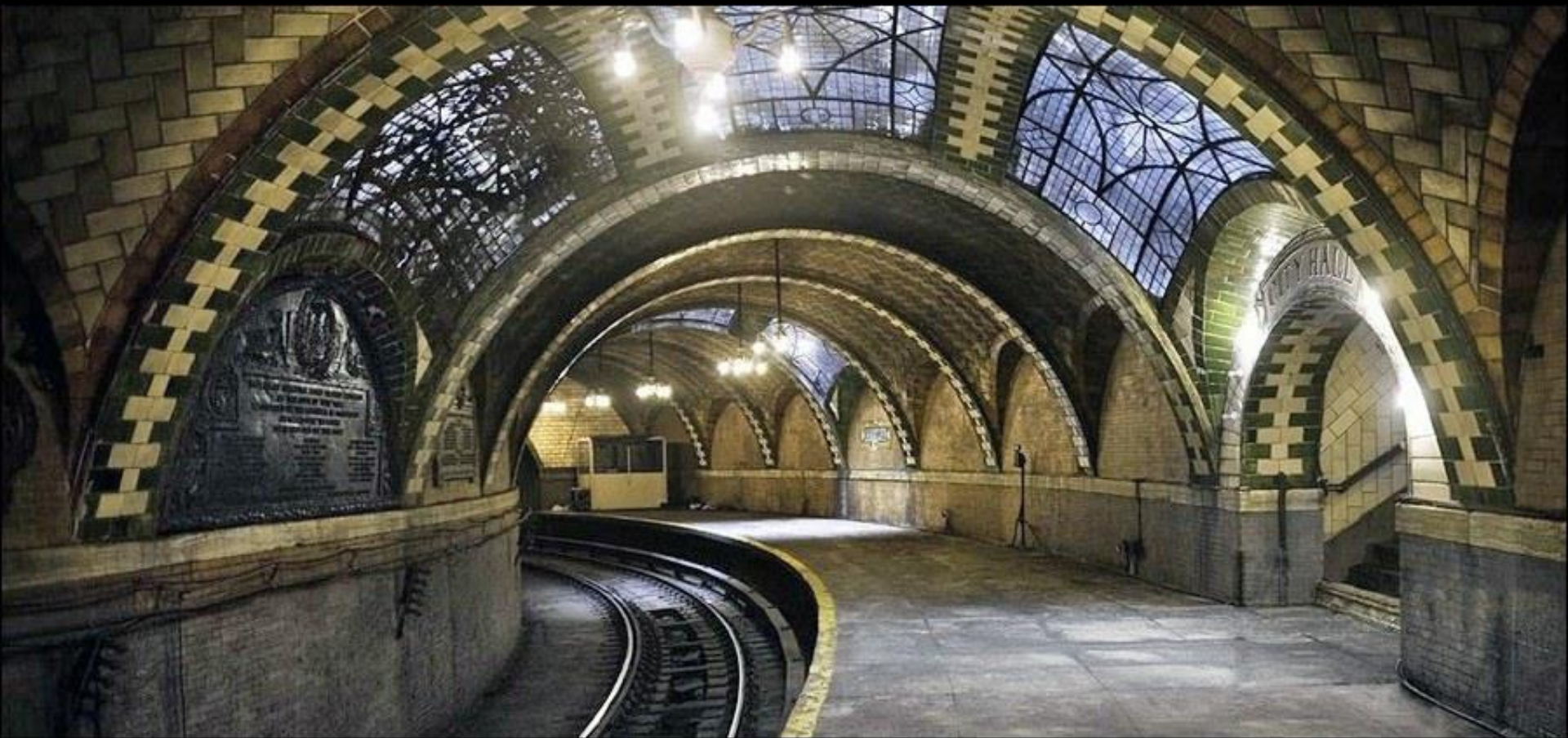
City Hall Subway Station, à New York