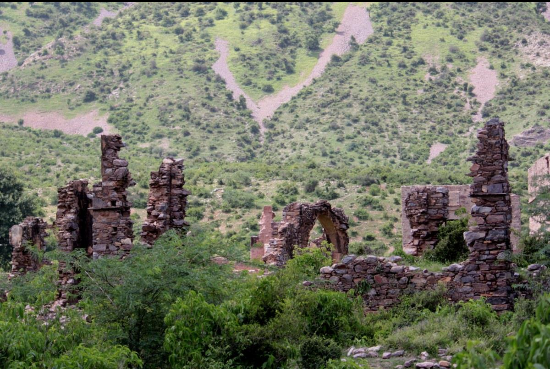
Bhangarh, Rajasthan, Inde