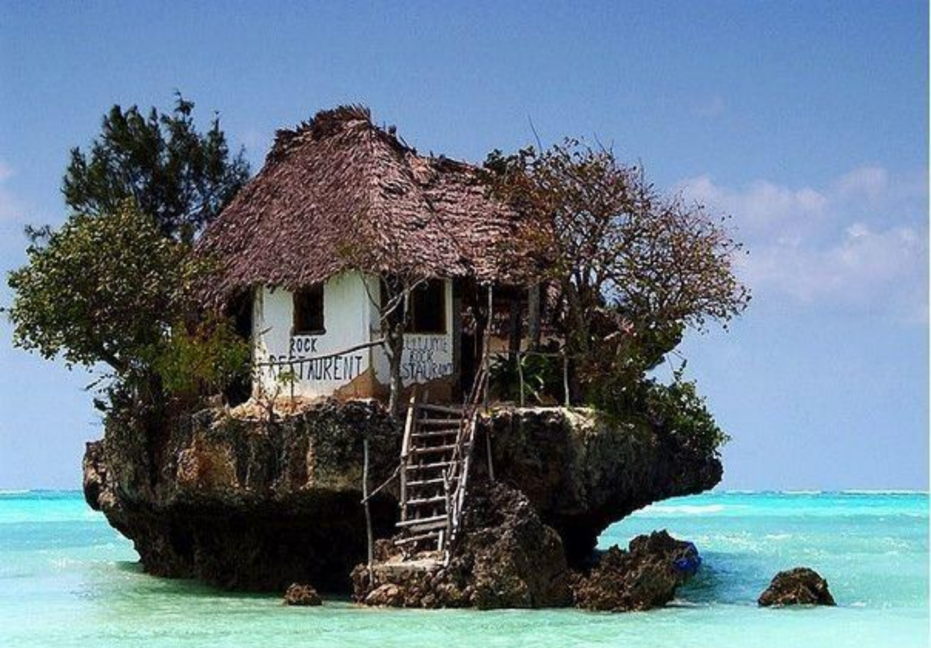
Restaurant sur un rocher dans l'océan sur la cote est de Zanzibar