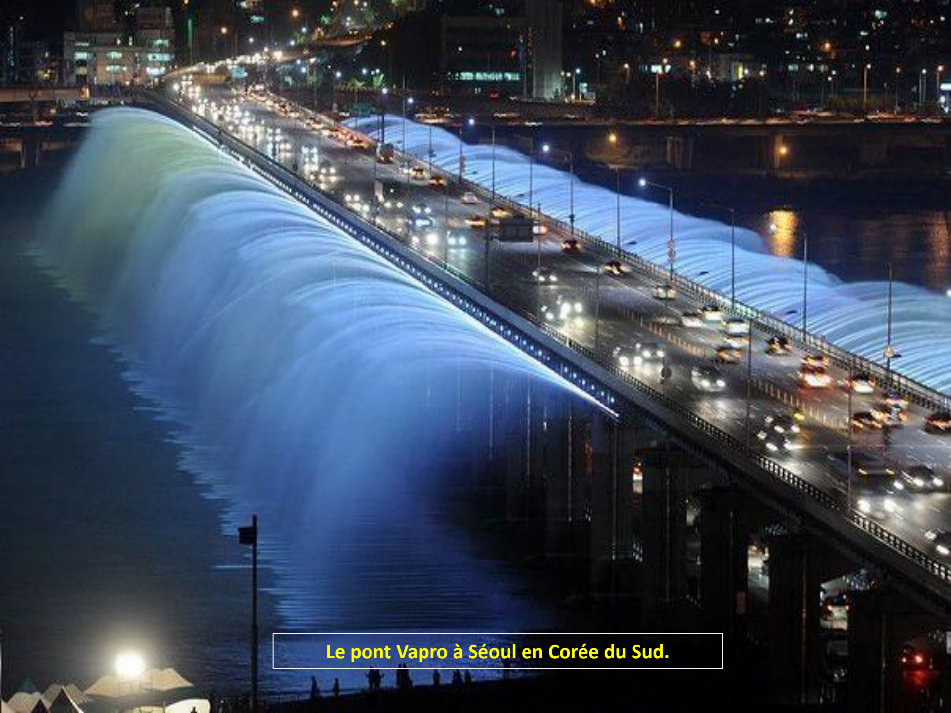
Le pont Vapro à Séoul en Corée du Sud.