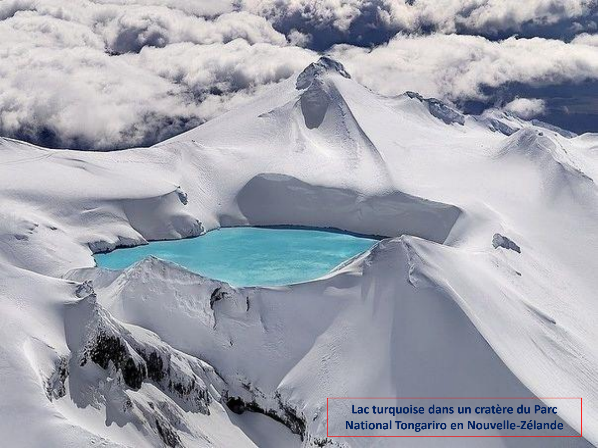
Lac turquoise dans un cratère du Parc National Tongariro en Nouvelle-Zélande