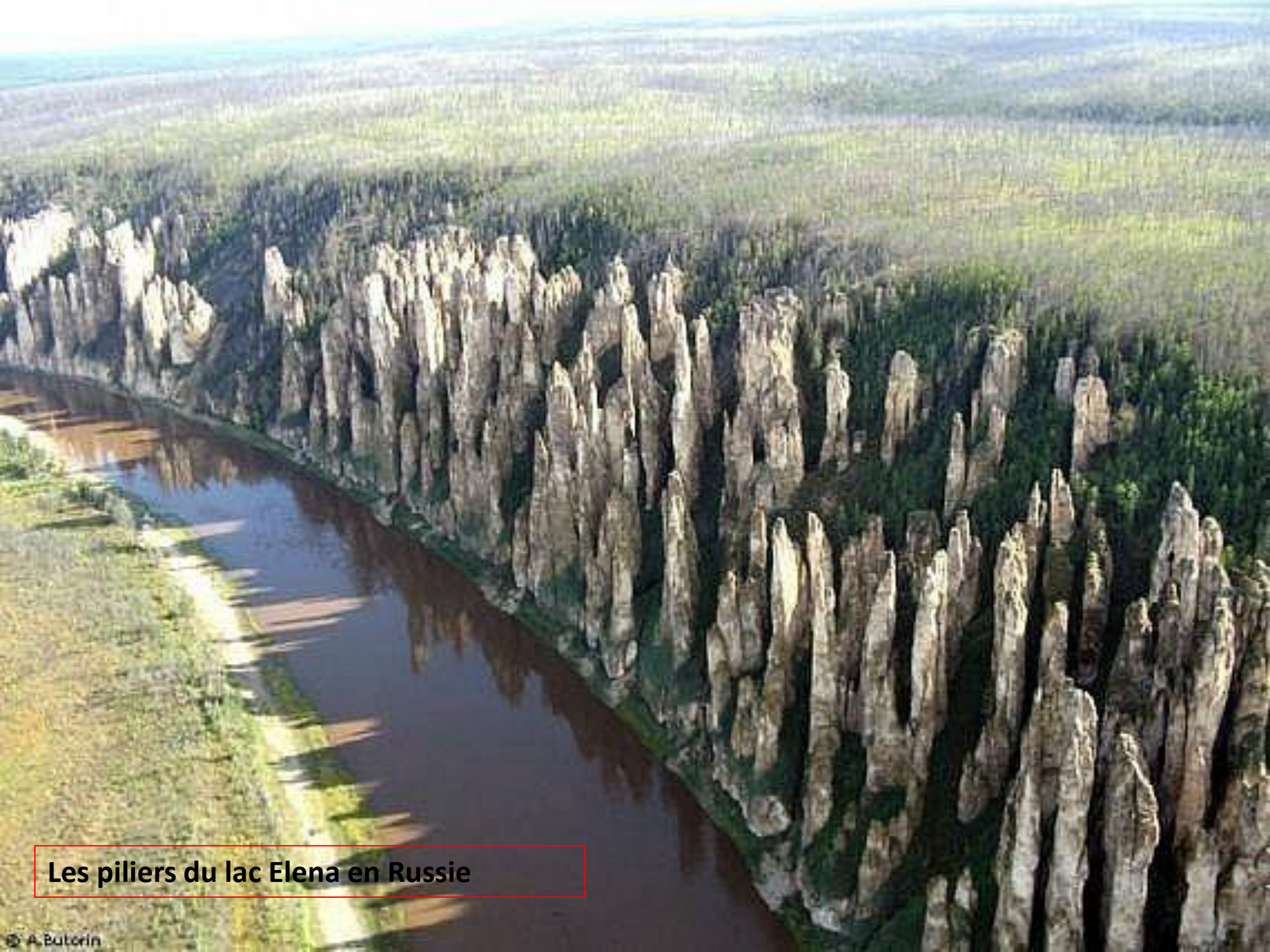
Les piliers du lac Elena en Russie