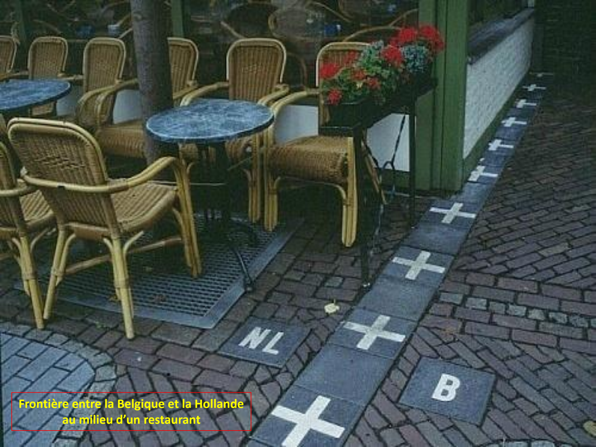
Frontière entre la Belgique et la Hollande au milieu d'un restaurant