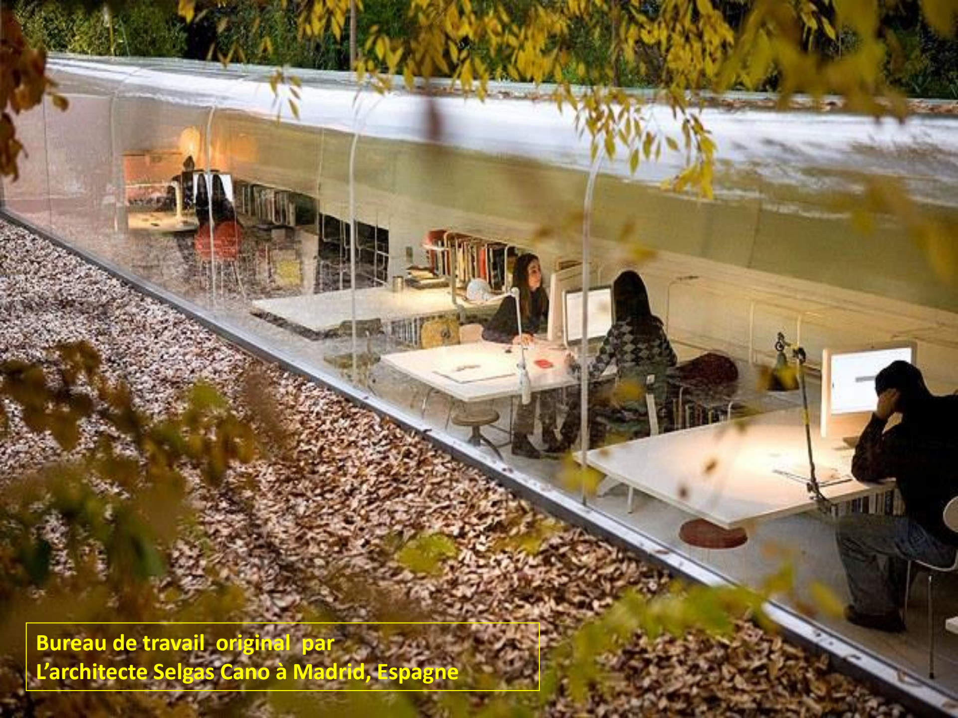
Bureau de travail original par L'architecte Selgas Cano à Madrid, Espagne