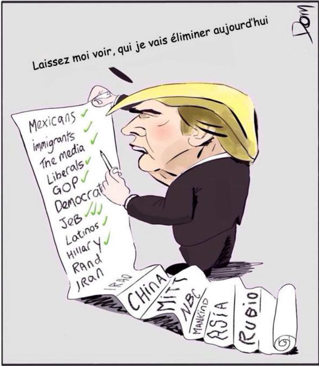
TRUMP'S PRESIDENTIAL STRATEGY