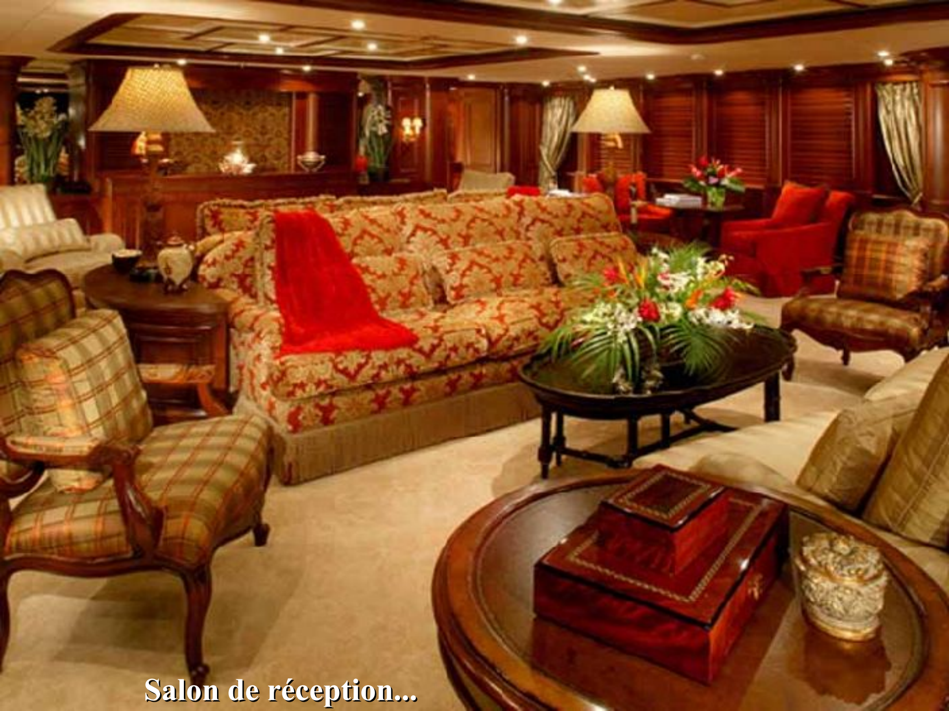
Salon de réception...