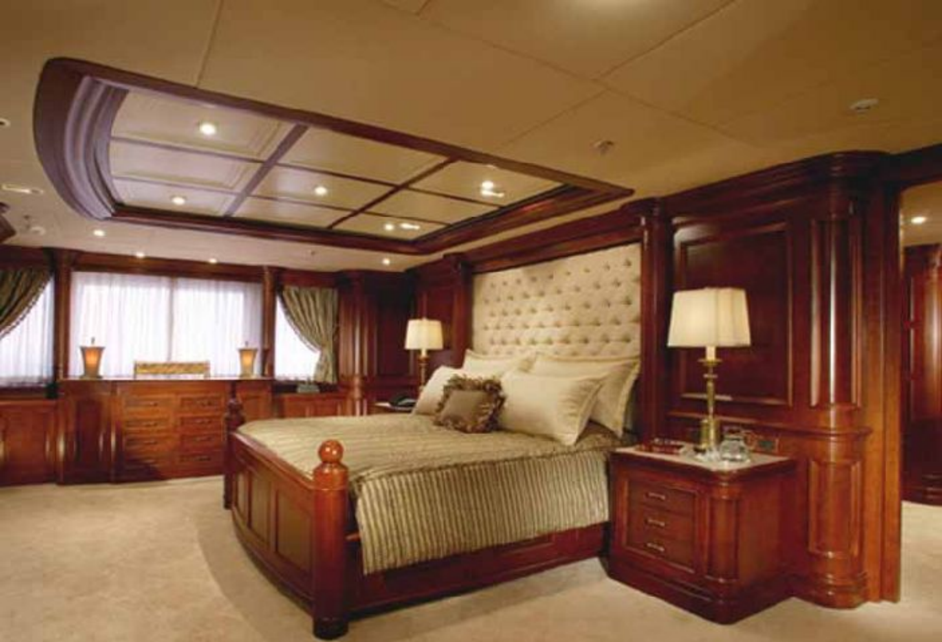
Petit lit douillet ...