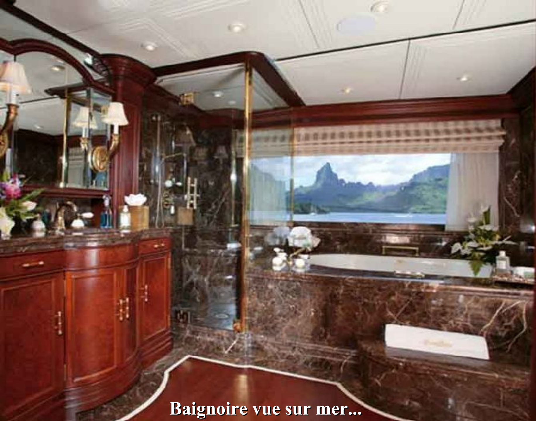
Baignoire vue sur mer...