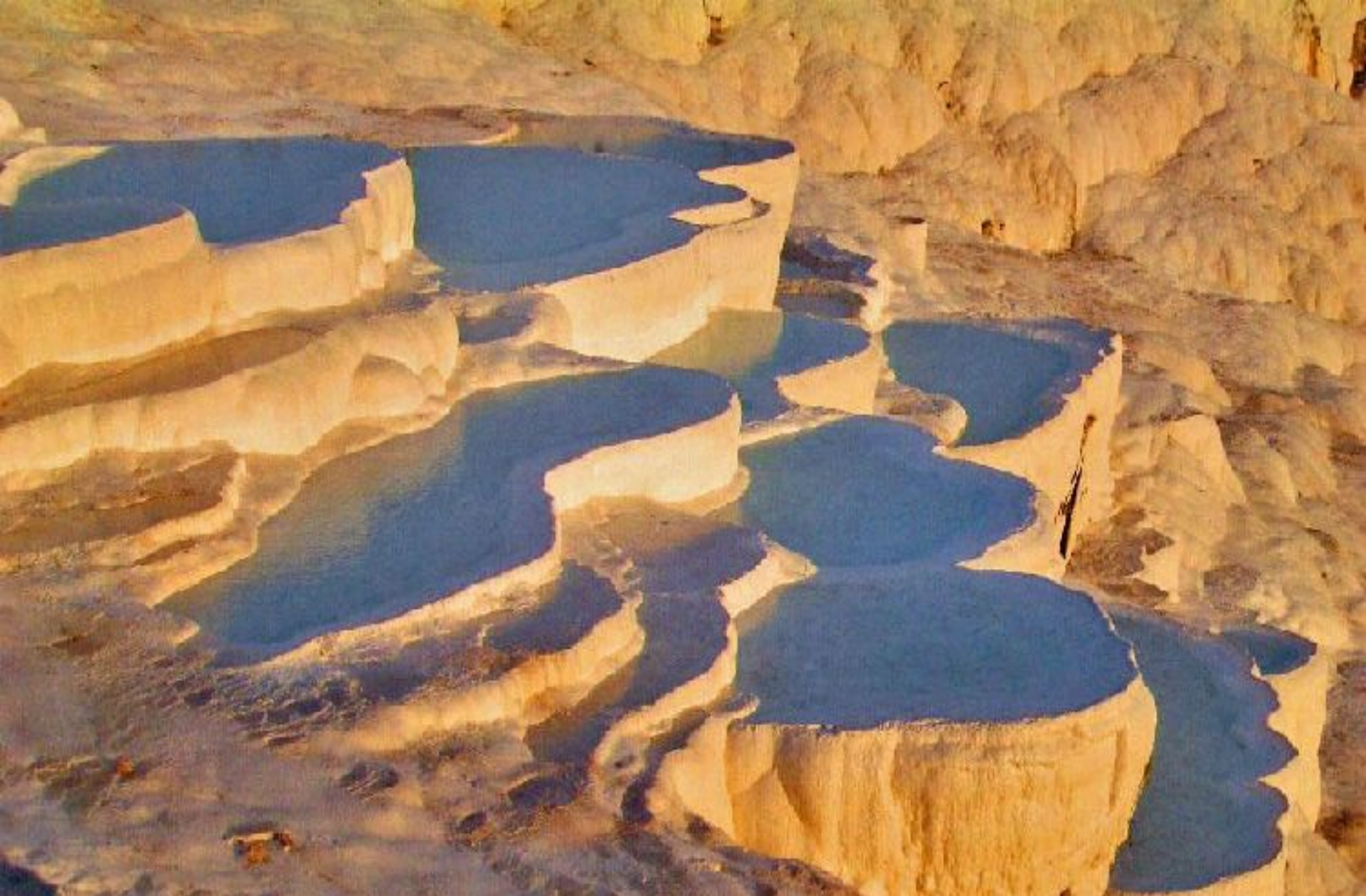
Tant les cascades comme l'eau changent de couleur en accord avec la lumière solaire qui les illuminent et l'effet est réellement surprenant.