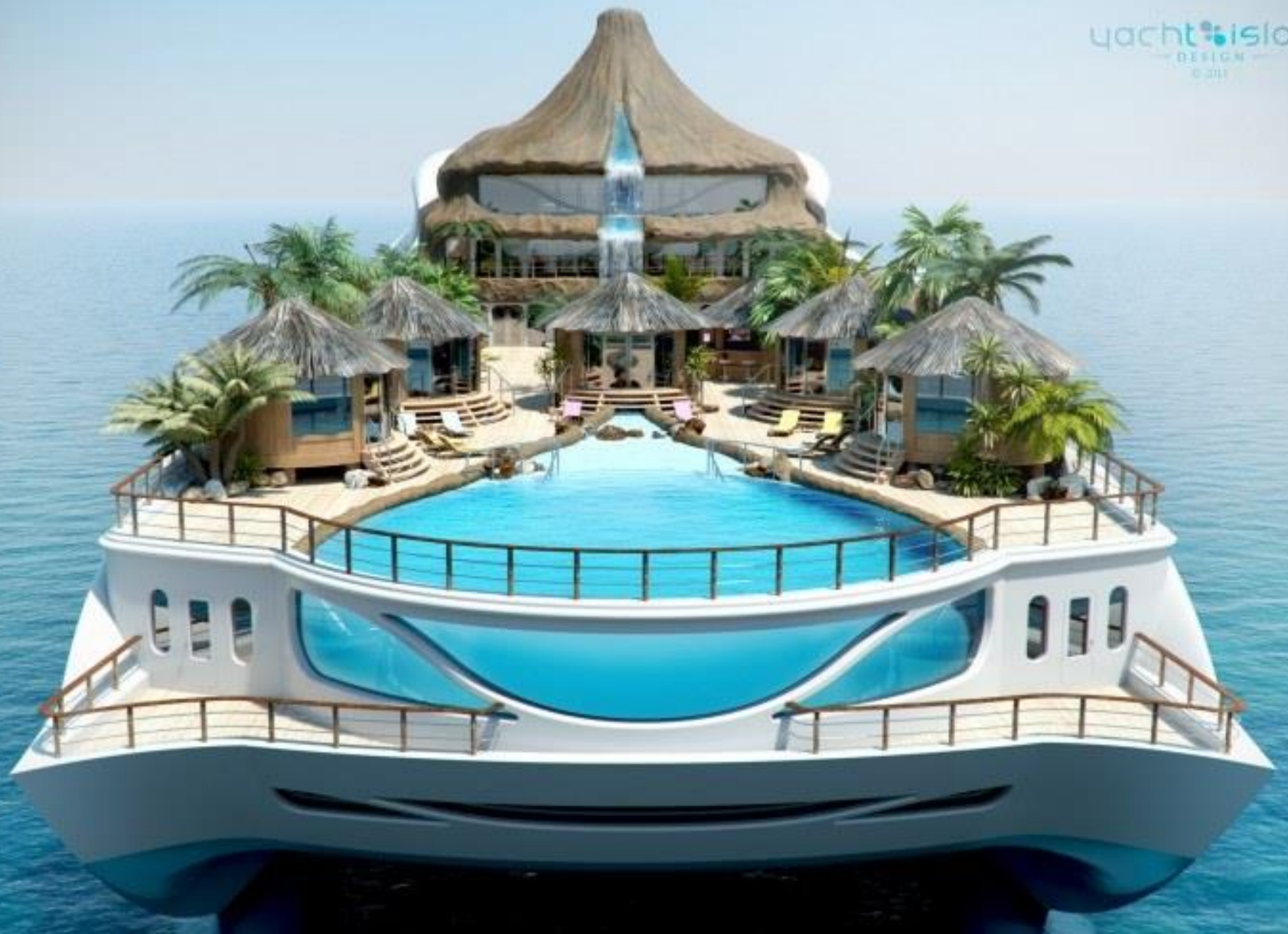
Tropical Paradise Island : concept de yacht à thème de luxe