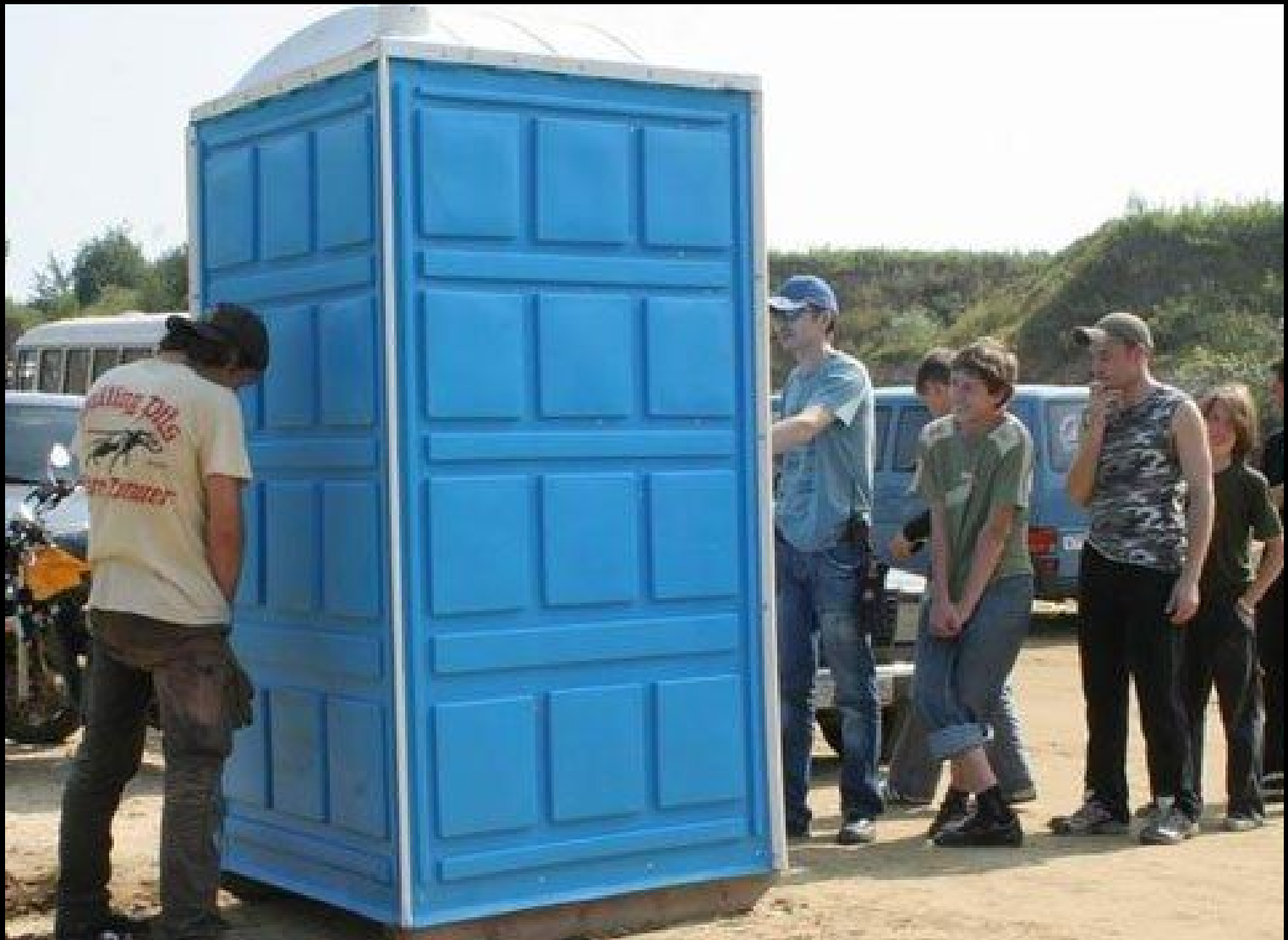
Un petit futé