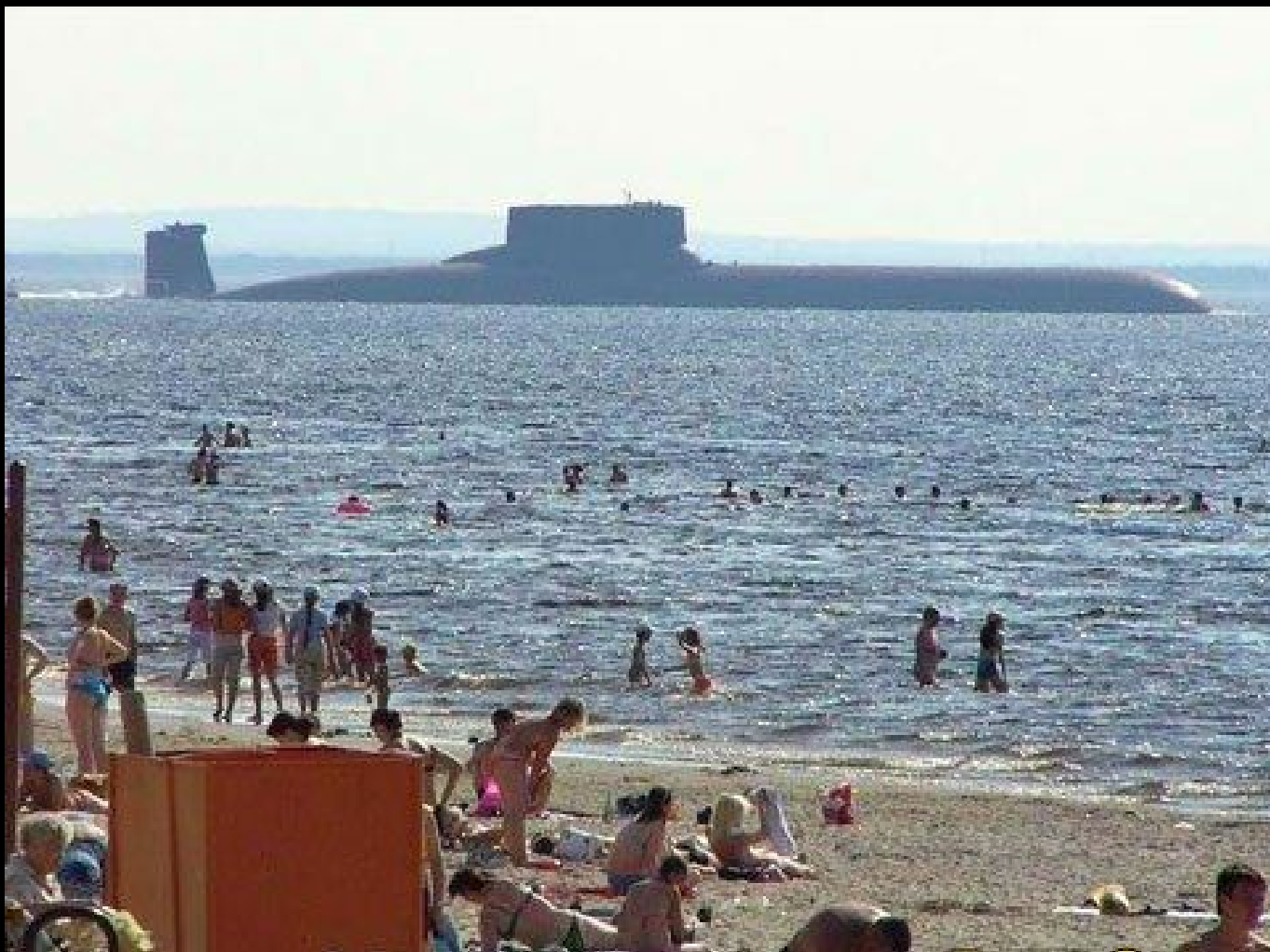
Les jolies plages du Liban