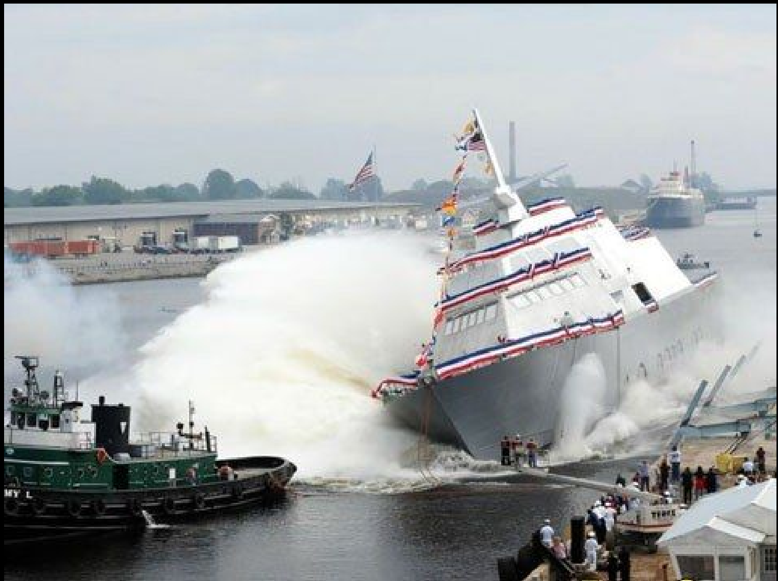
Virage au frein à main