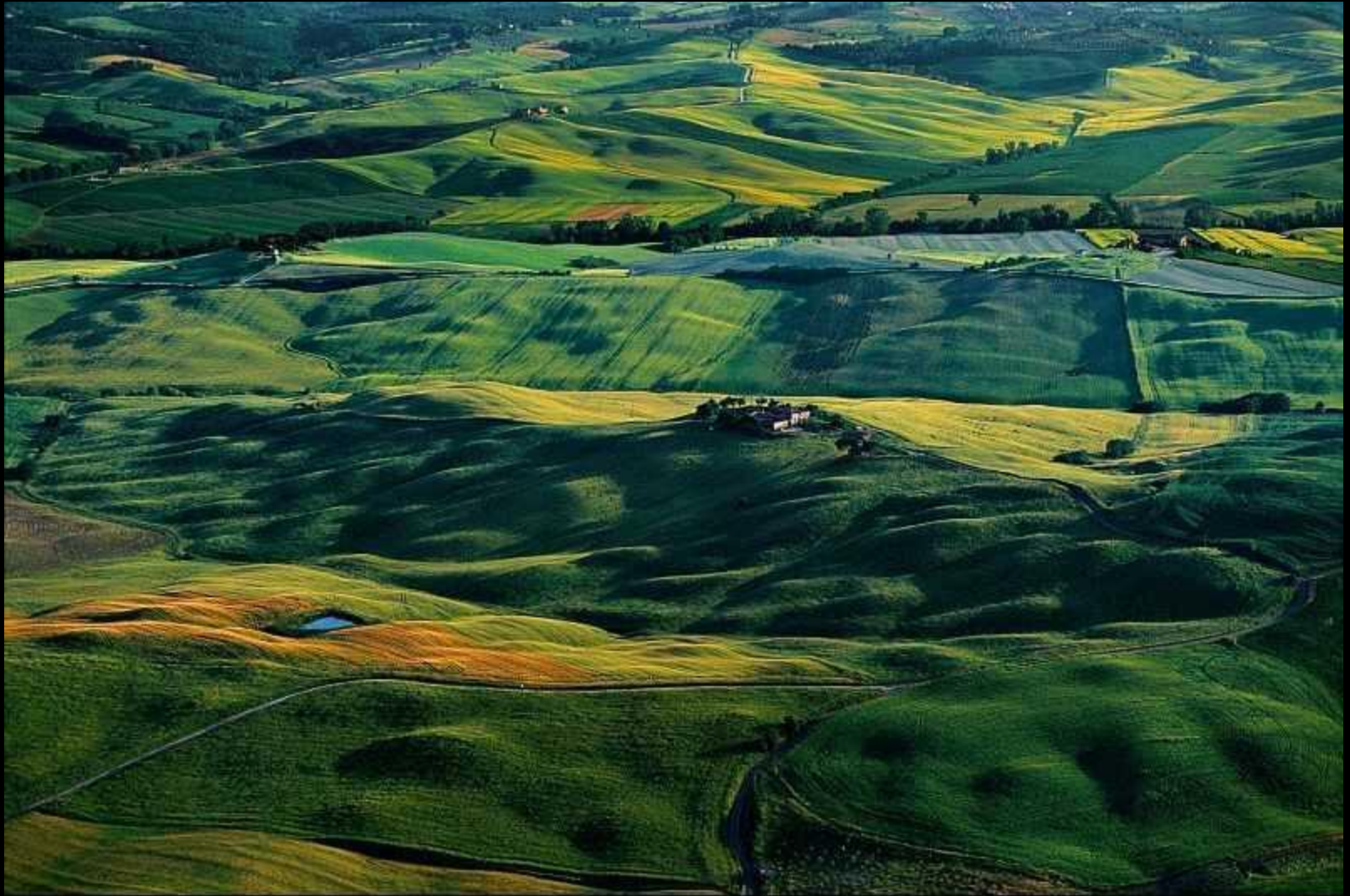
Campagne aux environs de Sienne, Toscane, Italie (43°19' N - 11°19' E). http://www.gannarthusbertrand.org