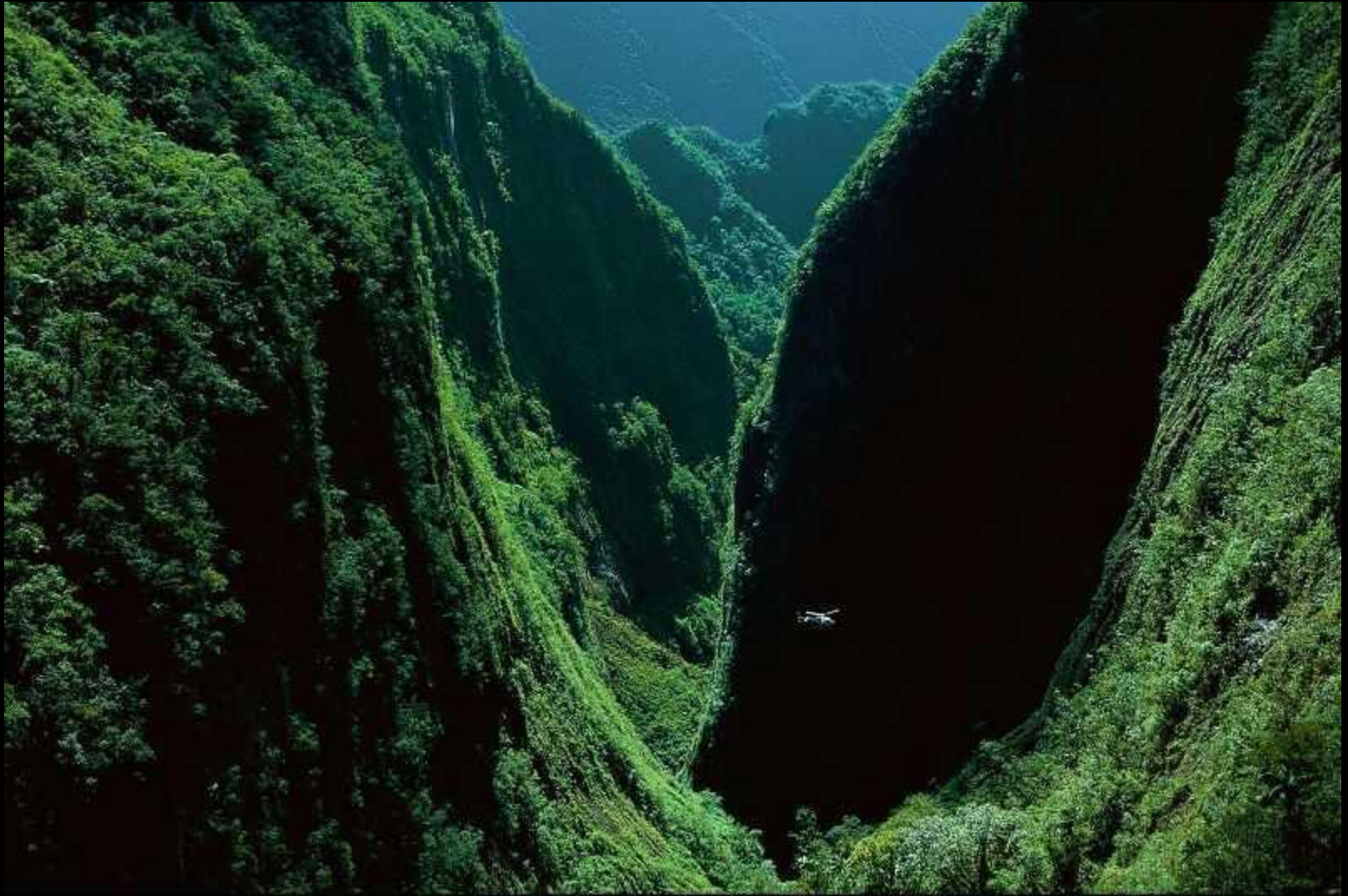
Gorges du Bras de Caverne, Ile de la Réunion, France. (S 21°01' E 55°33') http://www.gannarthusbertrand.org