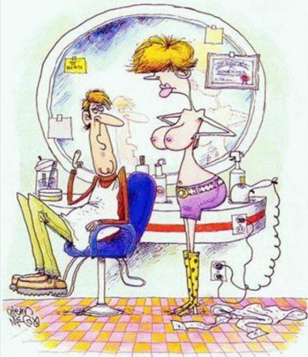
En fait, quand je vous ai dit de dégager le haut je vous parlais de mes cheveux